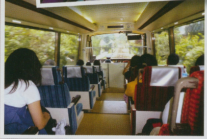
●圖9 黑船號或者踊子號第一號車都有全景 ●圖10 黑船號加踊子號

往下田的路上，順風地搭上了伊豆急行的黑船號。黑船這個名詞在日本的歷史裡面是有著非常重要的道標意義的。約一百五十年前，亞美利堅國的提督培利帶著交涉指令硬是打開了德川幕府的鎖國，也開啟了日本往現代化的轉捩點。這個文化與歷史衝擊對於日本人的恐怕不只“轉變”這兩個字可以形容。隨著那個風起雲湧的幕府末期時代，耗盡了許多當時英雄人物的血汗性命萌芽出近代的日本。所以，對於那個時代的歷史日本人似有著無限的憧憬。而下田，除了美麗的海景，艷麗的海灘與溫泉，豐富美味的海鮮之外，正是黑船來日的登陸點。而對於一百五十年後的台灣牙醫師自助旅行小隊來說，這裡是可以吃到海鮮，海邊玩水以及參觀水族館的好地方。如果讀者還沒忘記上文所提的，筆者家的媽媽大人是指定要找到「可以跟海豚一起游泳」的地方，於是一行人便來到了下田水族館。其實如果真的要與海豚一起浮潛，在下田有幾間民宿旅店有這樣的情境服務的。不過，因為團體過大預定不易或者時間不足太忙等等足以轉移筆者不夠用