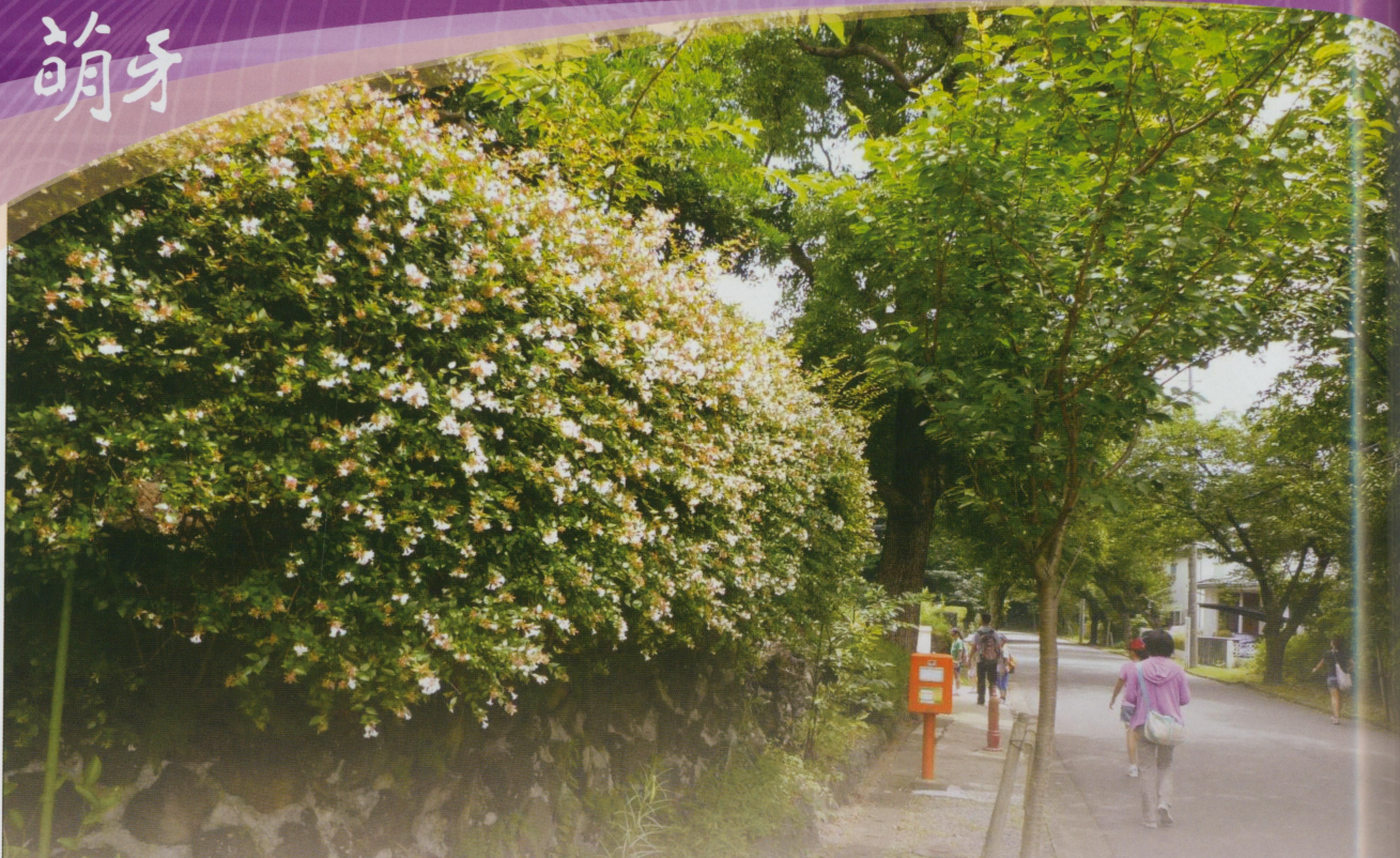
●伊豆城崎海岸周邊的別墅街道