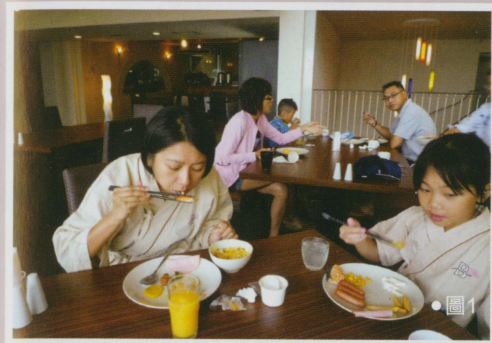
●圖1 洋風溫泉旅館，平價舒適 ●圖2 金色夜叉（註：故事是女的甩了男的） ●圖3 熱海溫泉街

身 為台灣的牙醫師，每每在與其他國家醫師聊到自己的工作生涯的內容以及每日十三小時的工時，總會聽到一陣驚嘆「你們台灣的牙醫師體力真好」，「會不會太辛苦了」等等評價。百感交集之餘，還是得乖乖地回國面對自己的職業人生。故此本人痛切地認為 偶爾的放鬆，逃避，旅行以及家族活動是有助於身體健康與世界和平的。