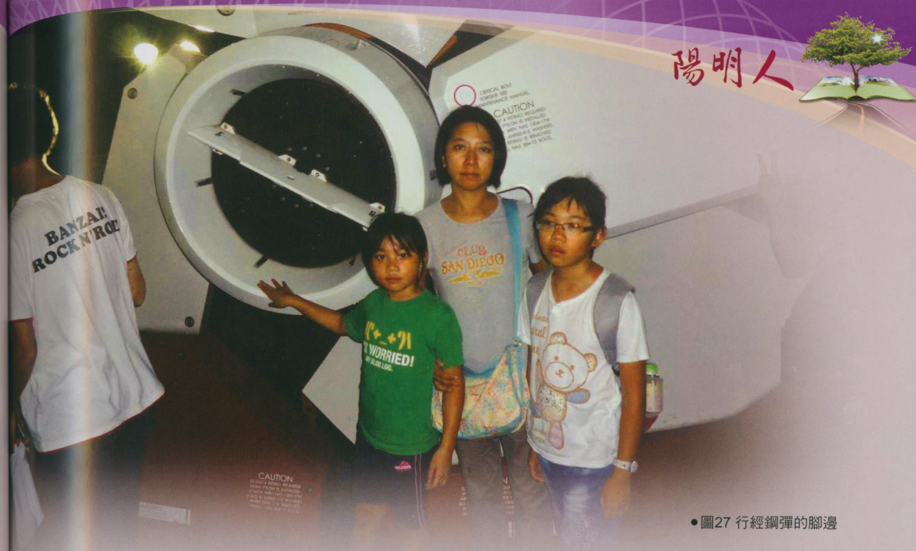
●圖27 行經鋼彈的腳邊

以找得到。果不其然，順利地讓小鬼們看到實物大小的卡通機器人。我想，在那個苦哈哈的年代只能最多看看盜版漫畫過癮，現在年頭是不一樣了。