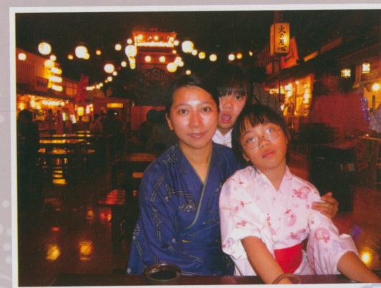
●圖28 吃喝玩樂的大江戶溫泉

稿的事情…（編按：喂～……）然後總能在乾淨而輕鬆的異國裡，從新審視自己的工作與價值，然後回國乖乖的工作。畢竟像筆者這樣的中年大叔如果抽掉了牙醫師這個能力與工作，可能跟東京街頭睡瓦楞紙箱朋友們差距不大。重新印證了工作的成就感與心得後，再回到台灣的職場，可能更能心安氣定也說不定。而諸位看倌，想必也有一個常常旅行的地方，工作累了就該休息。謹在此以本文與大家分享經驗，希望有空更能把酒笑談旅行人情，旅行人生。萌牙