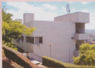
● 熟悉的系館。因為通風系統裝修，大門口堆滿風管及建材的照片就不po了。