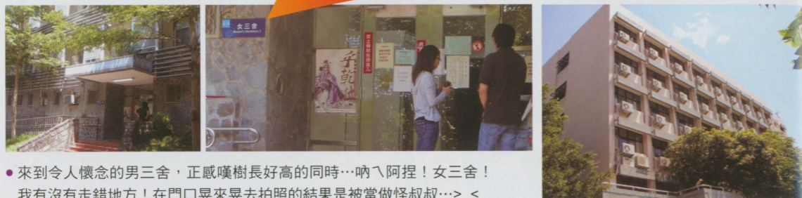
● 來到令人懷念的男三舍，正感嘆樹長好高的同時…吶！阿捏！女三舍！我有沒有走錯地方！在門口晃來晃去拍照的結果是被當做怪叔叔…>_<