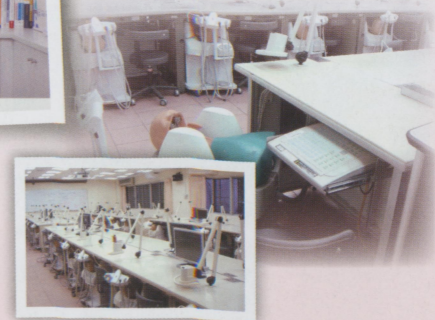
● 原來的 Fix Lab，95年教育部“國際一流大學計畫”補助增加設備，現在是“牙醫臨床模擬技巧訓練實驗室”，每個位子都有螢幕可見到示範者的動作，大家不必再擠破頭在老師旁圍一圈了。