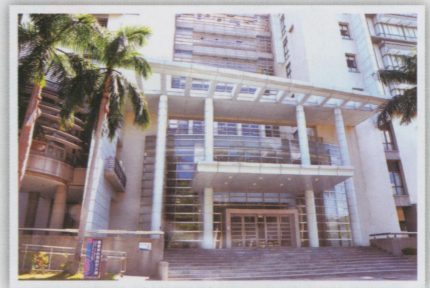
●很棒的圖書資訊暨研究大樓。至於山上原來的圖書館變成醫學館了。