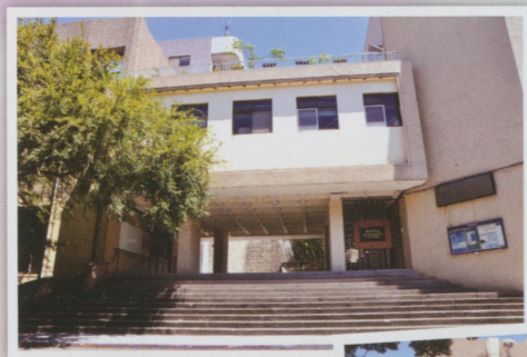
● 很久以前的社團活動中心，有些校友應該在此耗費不少時光（好啦～我就是！）二樓的西餐廳也消失了。現在是人文與社會教育中心。