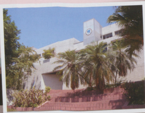
● 豔陽下，高高地掛在新建電梯結構上的陽明牙醫系徽。以後有空一定再回來！