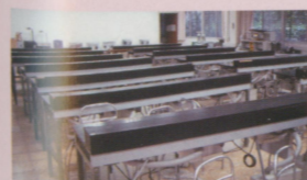
● 210的活動復健Lab倒是沒變。不過今年新生入學全員到齊共47位，一個都沒少，將來設備不知夠不夠用？