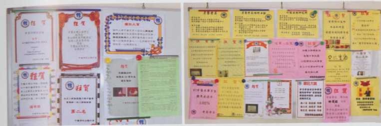
● 一進系館，牆上恭賀的是各個比賽或優良表現。有臨床研究計畫得獎，有文學獎，有論文獎，陽明的學生及老師們在各方面表現得都很棒！