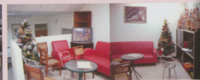
● 一樓系辦外的小交誼廳，獎盃已經放不下嘍～