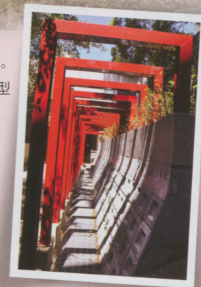
●這裝置造型是在哪？答案是宿舍區要到中餐廳（現在叫學生餐廳）的步道，以前旁邊是一排社團活動的手繪海報櫥窗；現在少了熱鬧卻多了人文幽思。

化啊？有那麼誇張嗎？但屆次比我（12屆）更前面且久未回校的學長姊，沒看標題可能以為我在po哪地方的遊記咧～