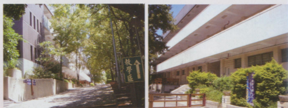
● 教學區。不過現在有兩道柵欄，沒法再在上課打鐘時才從宿舍區騎機車直衝教學區或實驗大樓趕點名了。