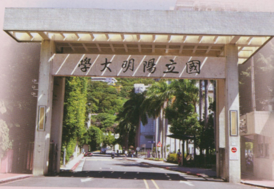
●大門口——民國83年之前寫的是“國立陽明醫學院”，寫法是由左到右，還是由右到左？記得的請舉手！