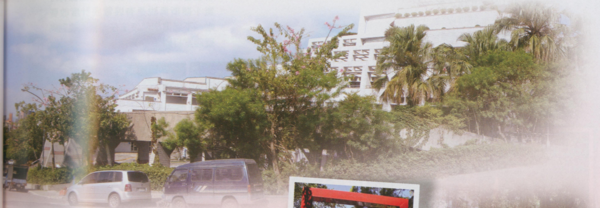
●山腰的活動中心，有餐廳、會議室及國際會議。以前我們畢業典禮還在榮總介壽堂咧～現在大型活動不必再向榮總借場地了。