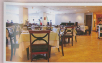
●這是哪裡？這裡是半山腰位於活動中心內的布查花園餐廳——既是餐廳也是藝廊，兩者融合於同一空間，用餐也很有藝術氣息。