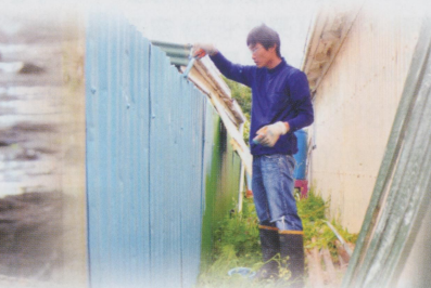
• 在換宿的BBH幫圍籬上油漆