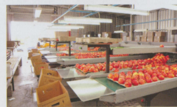
• 我們的工作就是檢查蘋果外觀，把較紅的那面轉到向上，然後放進紙箱裡。