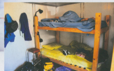
• 換宿也是會住到比較爛的環境的

等一晚的工作結束後，就是把整個工廠都乾乾淨淨的用清潔劑給洗一遍，讓我對這裡的食品衛生有蠻好的印象。待過工廠後，每次在超市看到自己曾經生產過的商品，都會拿起來看一下，看看裡頭的有