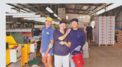
• 包裝的廠內動作需要很快速，做到背都麻了，雖然累但好在當地的資深員工對我們都很好。