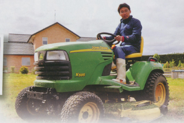
●很像在玩臉書上的農場遊戲