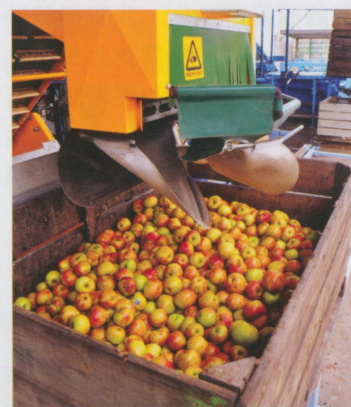
• 蘋果場中被挑選出來的壞果

麼快的，明知道我們沒辦法處理完，那我們只好降低品質。但我覺得和我共事的日本人會很盡力的想完成他，而且很少在抱怨。而對照組的法國或南美同事，則是不管機器出的速