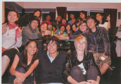
●蘋果包裝廠內的同事周末的聚餐（亞洲人還是比較會聚在一起）

度快慢，她們總是很慢，而且在別人忙不過來時，很少會主動協助。當然這印象會以偏概全，所以大家出國事都要注意好自己的行為以免傷害整體的形象。