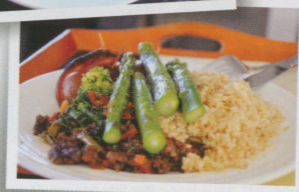
●拜男主人對麥製品過敏所賜，能天天有飯吃。這餐的牛肉煮得很好吃，我還特別問加了什麼？是洋蔥，是加了洋蔥。