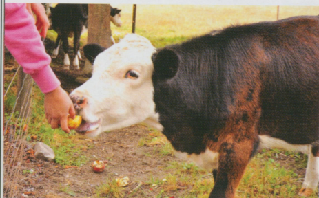
●拿淘汰的蘋果去餵牛，小牛們吃的超開心的，只是要先幫牠們把蘋果敲一下或弄小一點，不然牠們很難咬。