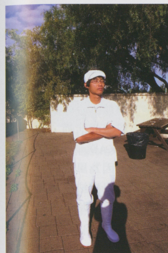
• 在海鮮工廠裡的制服，工廠內不能照相