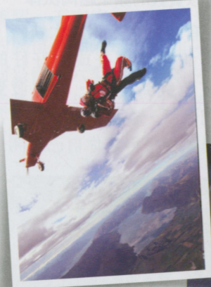
●從12000英尺摔下去，就算不敢跳教練也會把你推出去。我們在慘叫，教練在偷笑。

終於，膝蓋一彎，跳不出去，再彎一次，奮勇跳出。剛跳出去的時候真是自由落體的時間不到三秒就開始反彈，