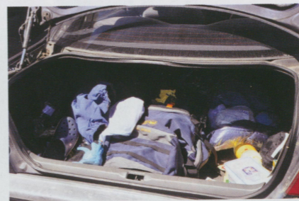
• 有車的好處就是行李不怕沒地方塞

待業太久，就可以回到工作崗位。出國的經歷沒什麼加分，也沒太大影響。我不想把這個念頭留到退休以後，畢竟幾時退休？能不能好好退休？退休後身體如何？是我無法掌握的，所以我現在就去做。