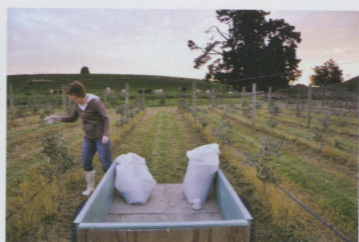
●幫果樹施肥 我只負責開車（還是怕我亂灑肥料浪費錢）

在Helpx網站找好換宿的地點，查好地圖，小心翼翼的開了過去位在郊區的房子。兩層樓的房屋，附近種了