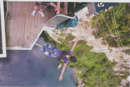
●從47公尺的跳台一躍而下，要跳之前真的很掙扎。