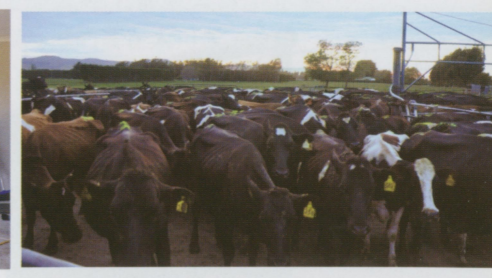
●天剛亮就要開始趕牛擠奶