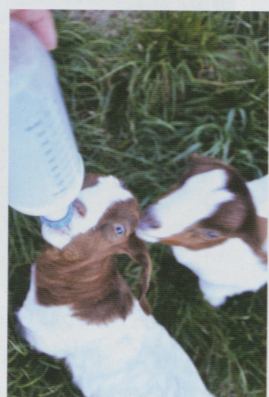
●餵羊 享受膝下成群的感覺，這兩隻是因為母羊不餵，才需要泡奶粉餵。