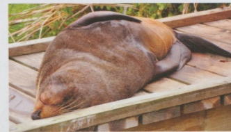
●海邊睡到四腳朝天的擋路海豹

不敢跳也會被帶著出去，因為是從12000英尺跳下，所以墜落的時間很長，前段是自由落體，後半開傘後，可以慵懶的享受飛在天上的感覺。