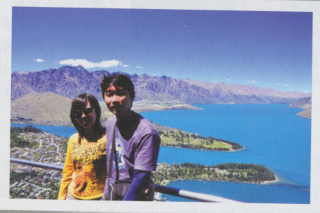
• 皇后鎮與Wakatipu湖 藍得不像話