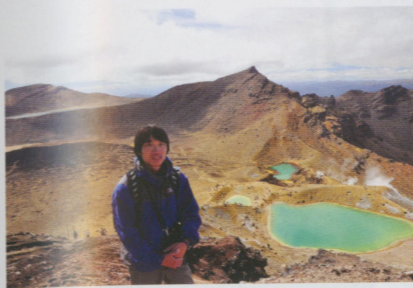
• 北島Tongariro crossing途中的綠寶石湖

但牙醫這行業應該是種保障，而不是限制，我不該一直想那少賺的錢，放棄這多年的夢想。至少在我回國後，不用