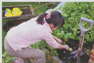
• 還有幫忙挖花園中的馬鈴薯，就變成晚餐的主食。