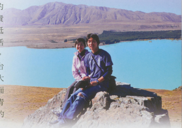
●我最喜歡的景點 Lake Tekapo

很感謝我的父母身體都健康，能讓我牽掛不大的去玩。也感謝親愛的老婆，能夠陪我去完成這件事，提前度這還要工作的大蜜月。讓在我三十歲之前的人生，沒有甚麼太大遺憾。能在紐西蘭旅行是相當愉快的經驗，自然美景美不勝收，不同的工作也讓我獲益良多。只是半年的經歷沒辦法一一詳述，寫得雜亂敬請見諒。