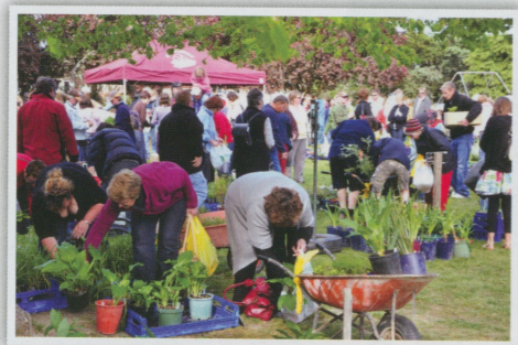
●假日市集 大家搶的不是名牌包包是讓家裡更美的植物