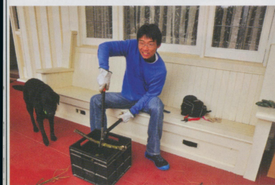
• 在但尼丁的人家中幫忙剪樹枝當冬天的柴火，這也是台灣不會做到的事。