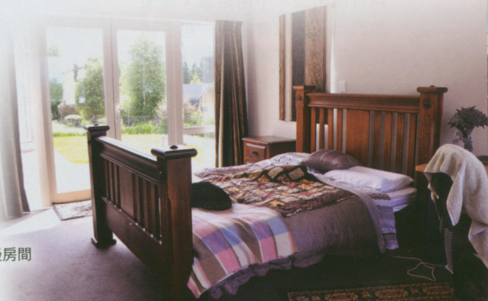
• 第一次換宿住到的高級房間

所謂換宿，一般是一天工作四小時，換取食+宿，若是只提供住宿就約是兩小時的工作，工作的內容從打掃、照顧小孩到訓練馬匹都有可能，時間則從幾天到幾個月，但都還是要視相處的情況而定。