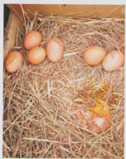
●撿雞蛋算是輕鬆又好玩的工作，破掉是因為那蛋殼太薄了。