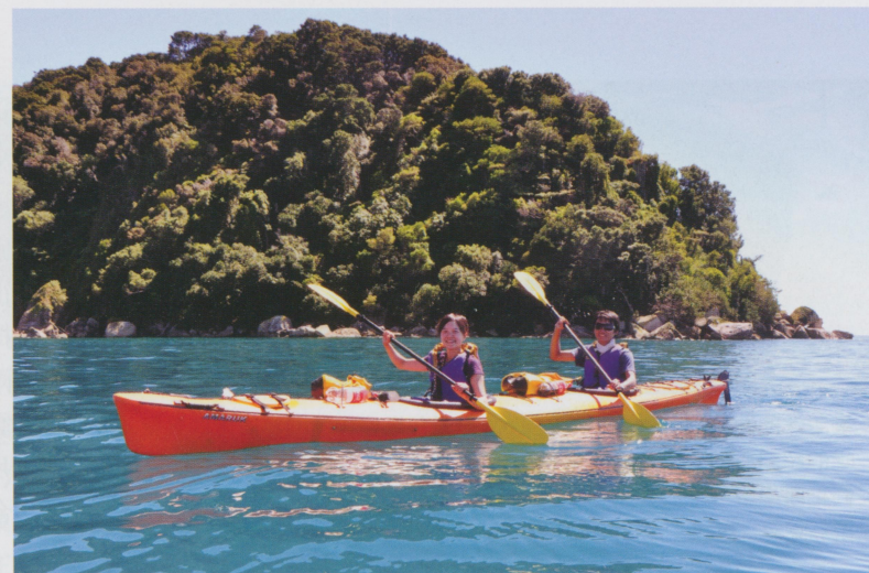
• 在海上划船，很累也很刺激（怕翻船）。手划槳，我的腳控制舵的方向。

被人工初選過的蘋果，經過機器後會被依重量而分到各條生產線上，我們則是把蘋果安置在大小設定好的托盤上，快速的檢查有沒有劃傷或是撞傷的痕跡，再把賣相比較好的紅色那面朝上，再一層層的裝進箱子。