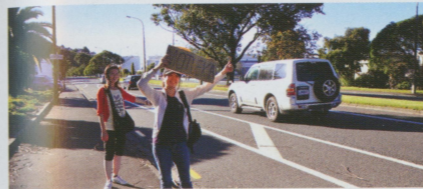
●如果要找一個地方來搭便車的話，相信紐西蘭絕對是合適的地方。

高空彈跳緊張的是在自己控制那跳出去前的掙扎，需要一定的勇氣，只是我覺得那並沒有比自己要開問診所的壓力來的大。而跳傘則是教練推著你出機艙，