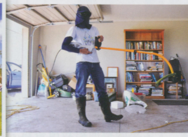
●幫忙除草 但這除草機太弱，沒兩天就報銷了。