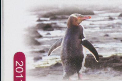
• 在Curio灣的化石海岸上打擾黃眼企鵝