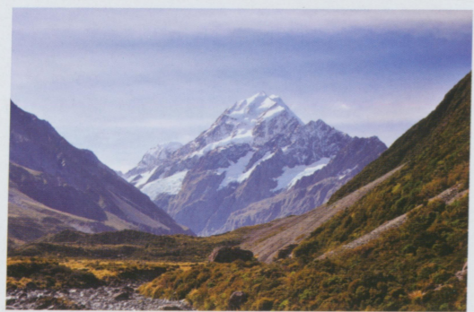
• 紐西蘭最高的庫克山3775公尺