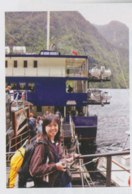
• 搭兩天一夜遊船遊覽Doubtful峽灣