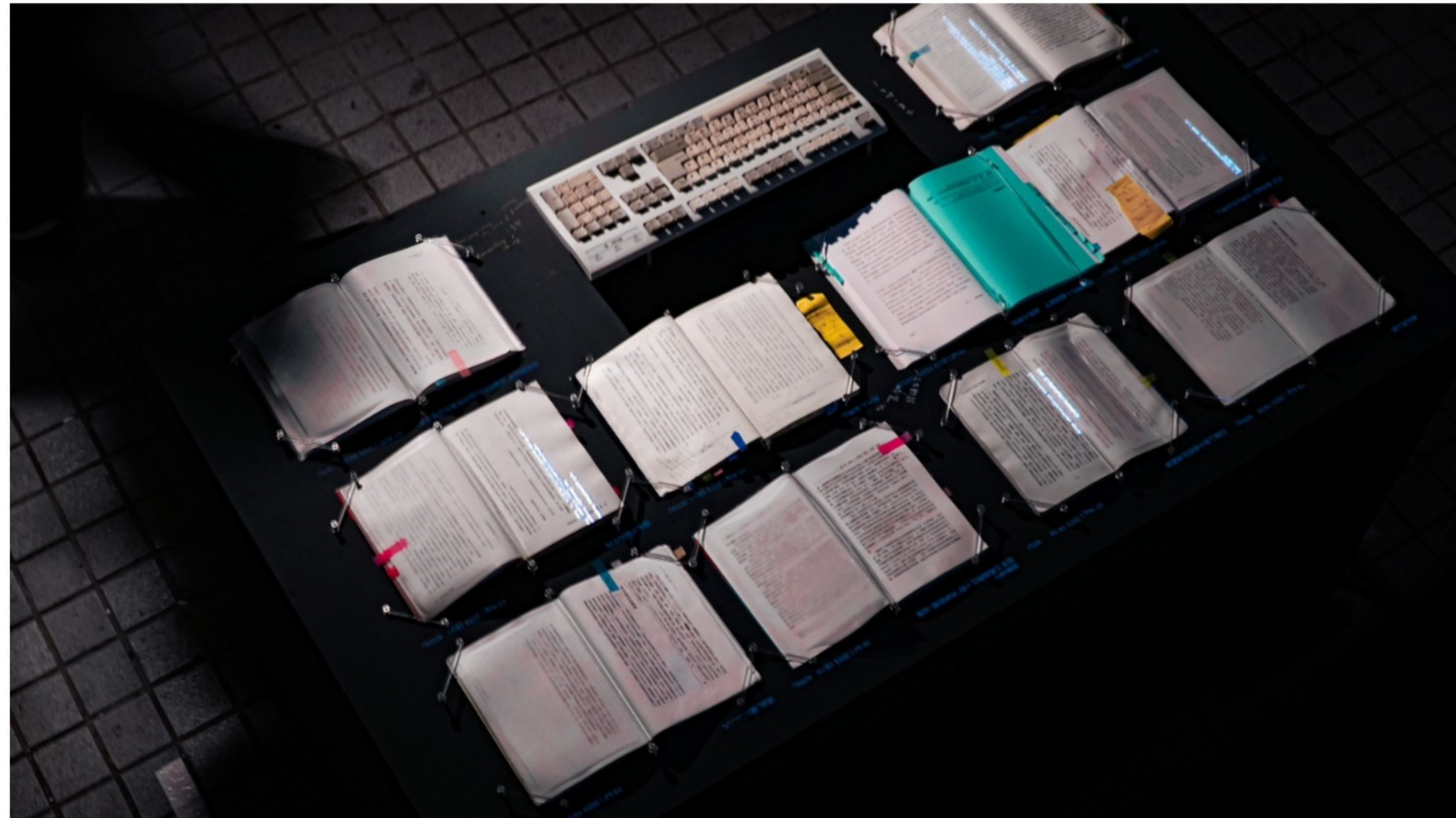
卓予杰〈The Ambivalence〉 2023，圖書館中書上的筆記、電子零件、AT大頭鍵盤、螢光顏料、樹脂、光，90*150*90cm

本展由卓予杰及百川學士學位學程共11位創作者共同策展：陳以荷、陳卓琦、林向靈、張翔鈞、張念晴、卓予杰、林舒蓉、林以嵐、李依玲、陳大森、洪敏祐。(依作品順序排列)