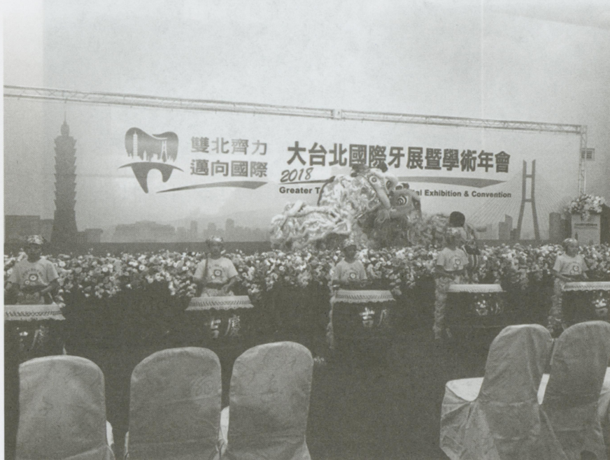
2018年3月31日-4月1日大台北國際牙展暨學術年會 大台北國際牙展暨學術年會活動開場典禮