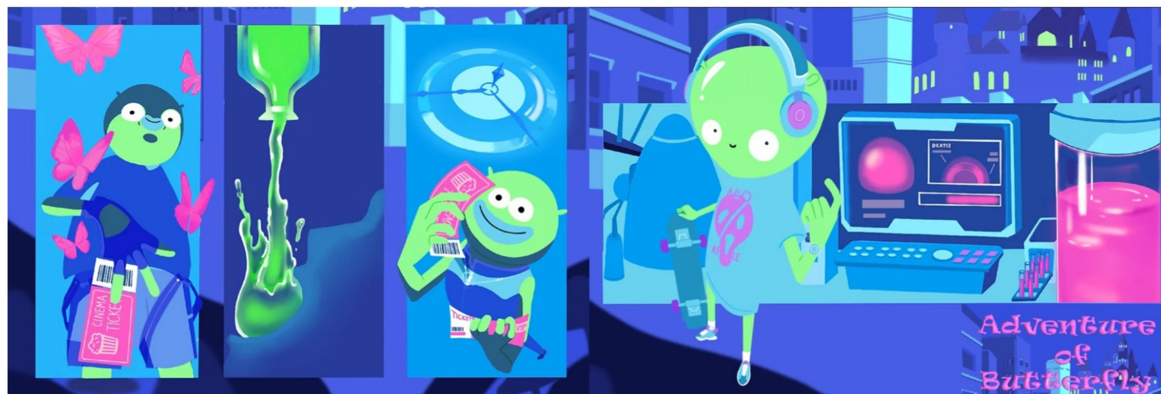
對孩子來說，「長大」是場冒險，對父母來說亦是。〈奶油飛國歷險記〉搭建實體場景，利用音效、燈光、演員互動等沉浸式互動環節，讓玩家能親身參與奶油飛國的故事。