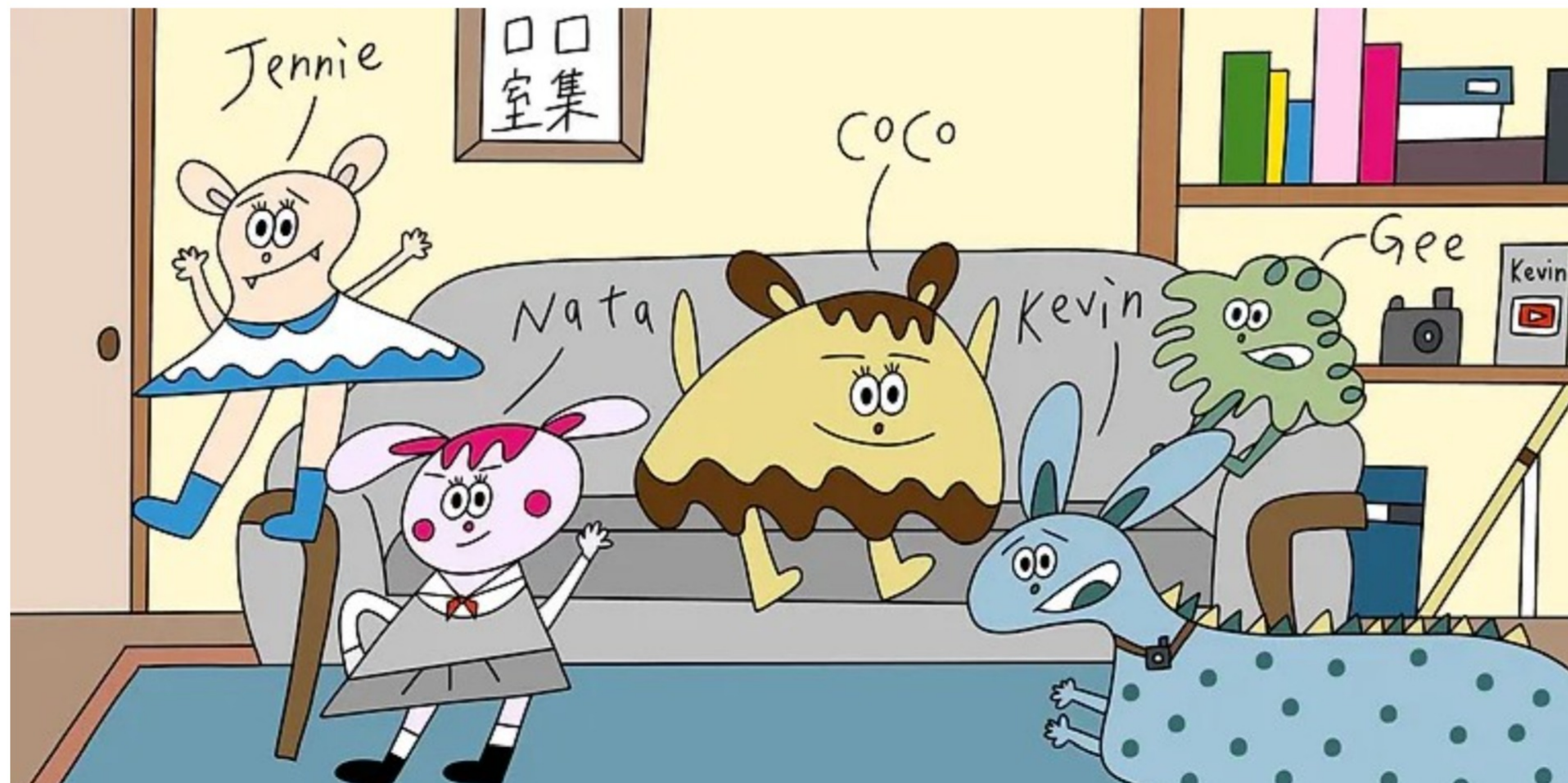
C 2 室集(coco room)從大學生的角度建立角色，畫出大學生日常生活中的情境、碰撞及觀點，透過各角色之間的矛盾以及突破困難後的成長，希望可以讓閱聽眾在在角色互動中找到屬於自己的共鳴。