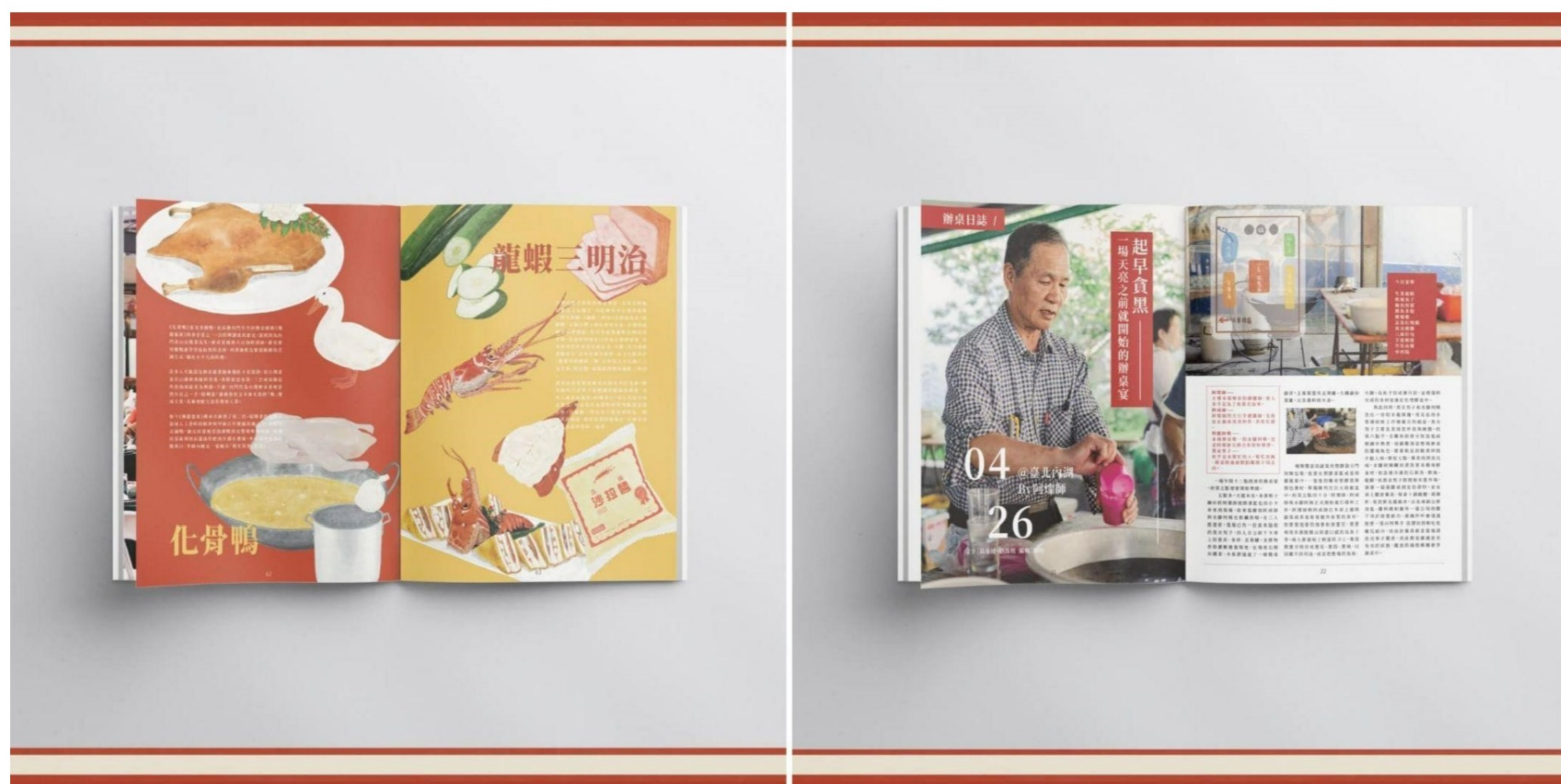
「既是辦桌，也是伴桌。」〈伴桌吃老虎〉透過雜誌記錄下辦桌文化，記錄下陪伴著臺灣人走過各式花樣繁華的年代的傳統記憶。