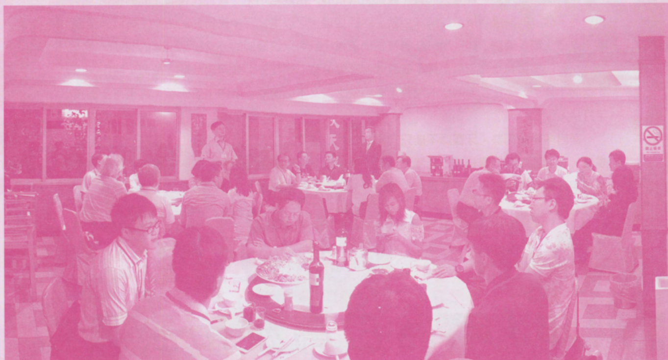
▲ 白勝方(8屆)副總會長致辭