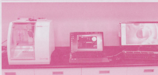
圖四、五 CAD/CAM牙醫精密儀器實驗室