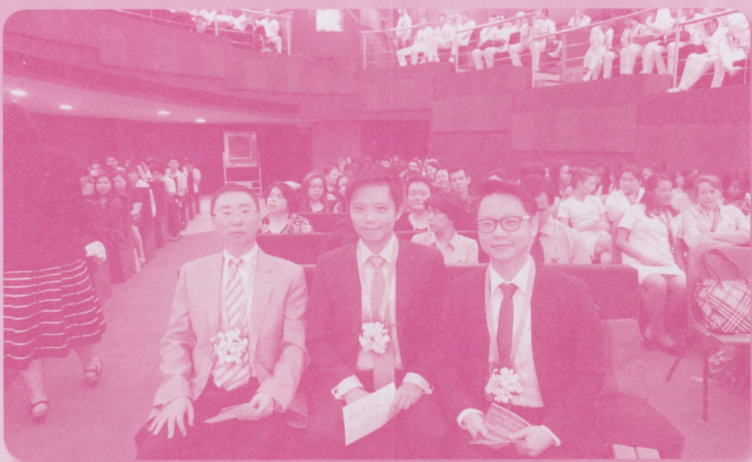
圖三、陽明牙醫學院與馬尼拉中央大學簽約，受到熱烈歡迎