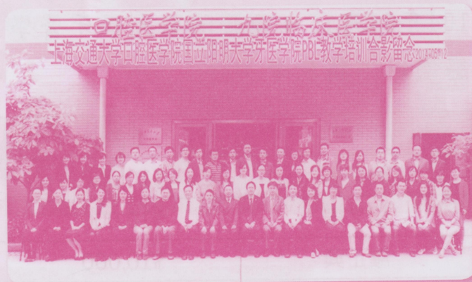
圖一、陽明牙醫學院赴上海交通大學口腔醫學院PBL示範教學

也許你會問，國際化，有名聲對陽明有什麼好處？台灣實在不大，但陽明需要長久經營，如果有朝一日，當老外提起陽明，就像我們提起哈佛、密西根等名校，那我們畢業生的出路就更寬廣了。