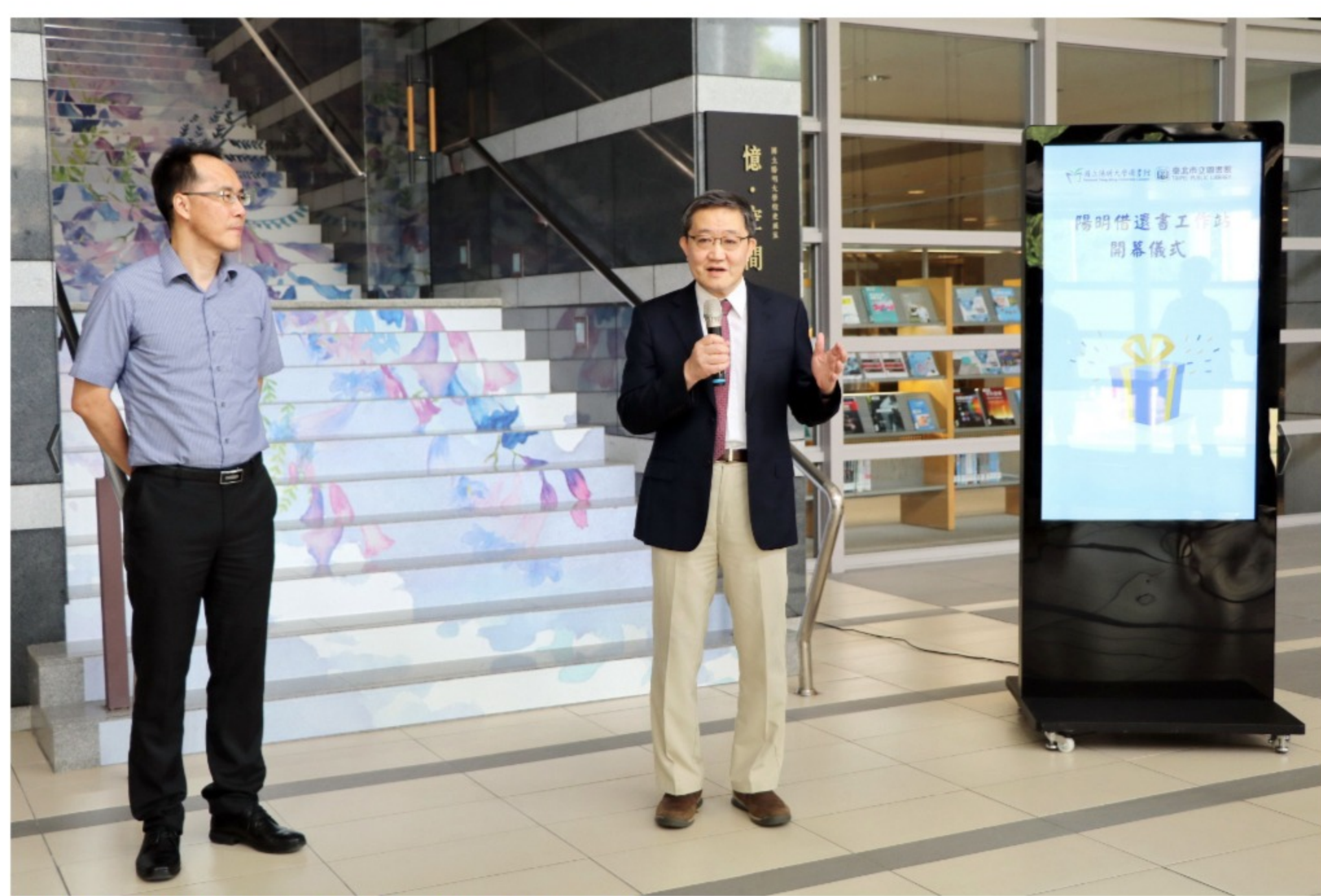
郭校長表示，陽明很榮幸成為臺北市第一個提供這項服務的大學

北投區與大安區分別有五所大專院校，是臺北市12個行政區中大學密度最高的區域；尤其陽明所在的北投區，具有三所以生醫醫療為主的大專院校，加上鄰近的臺北榮總、振興醫院、新光醫院與三重總醫院北投分院等，具有發展成醫療文教大學城的潛力。