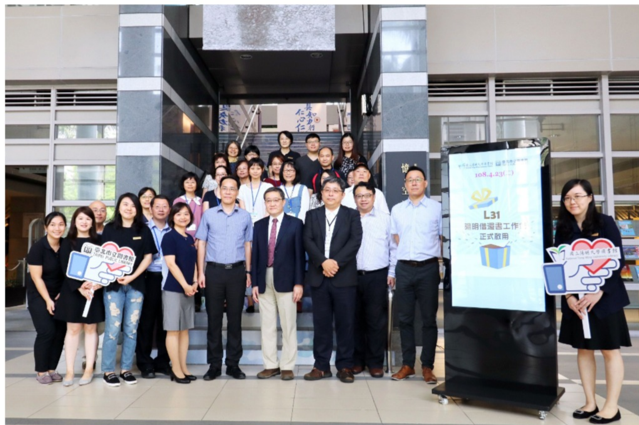
啟用儀式與會人員大合照

北投區原有的稻香分館因改建閉館，這次與陽明大學的合作，正好填補稻香分館閉館的空缺。未來稻香分館重新開館後，臺北市圖在北投區的借閱服務據點將可提升到8個，僅次於文山區與大安區。