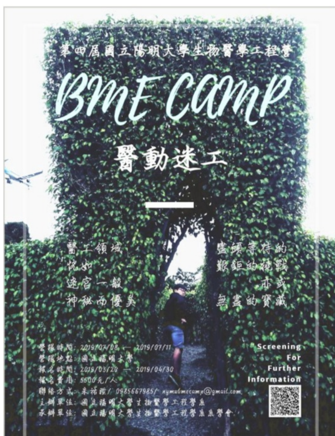
第4屆「生物醫學工程營」於7月8日至11日舉行

活動網址： https://www.facebook.com/ybmecamp/