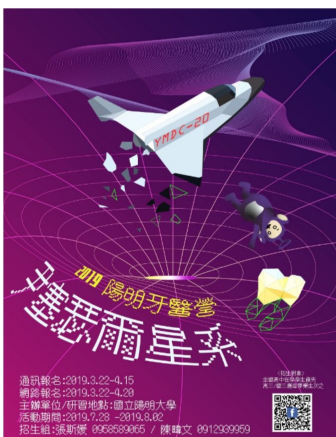
第20屆「牙醫營」於7月28日至8月2日舉行

活動網址： https://www.facebook.com/ymentocamp19/