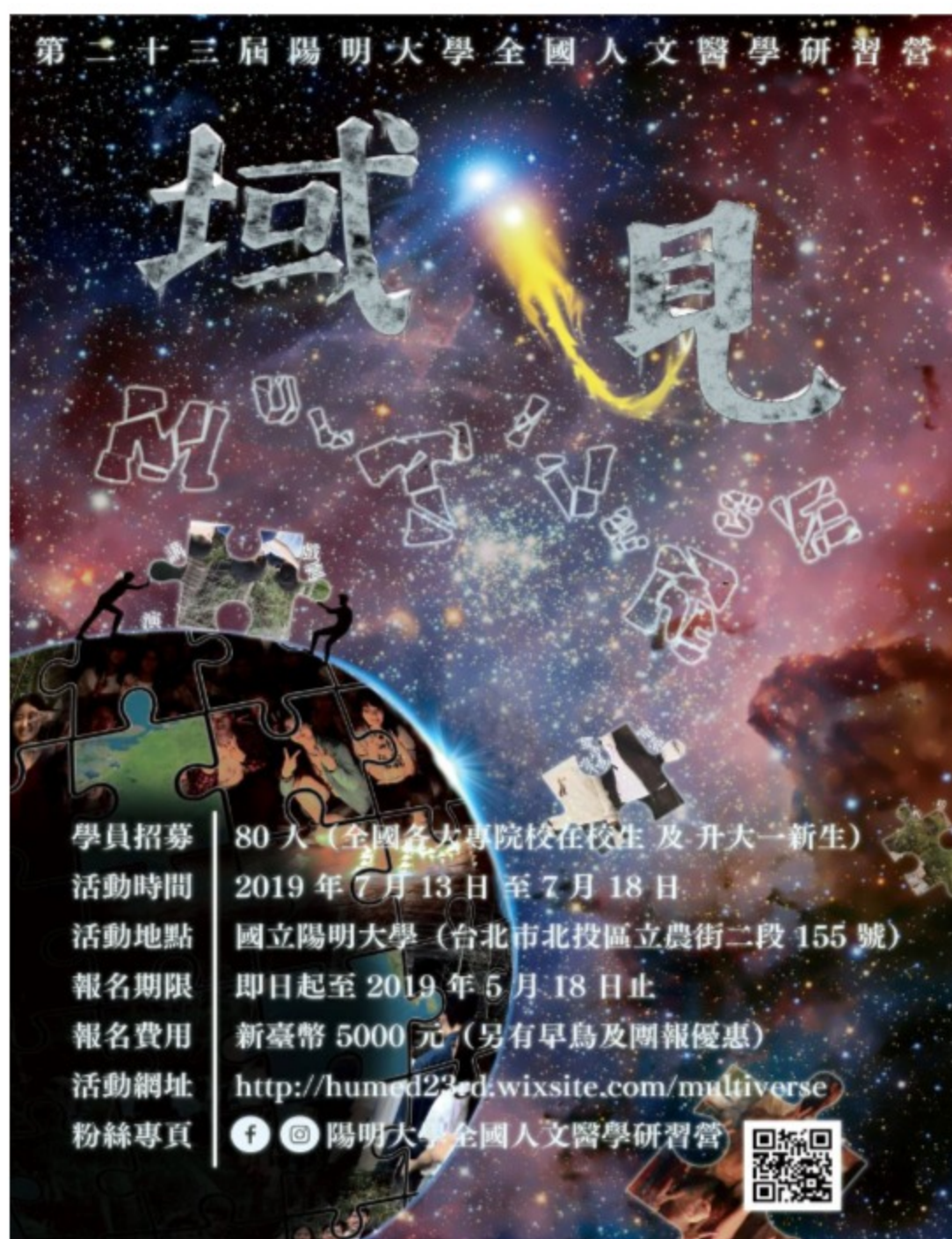
第23屆「全國人文醫學研習營」於7月13日至18日舉行

活動網址： https://humed23rd.wixsite.com/multiverse