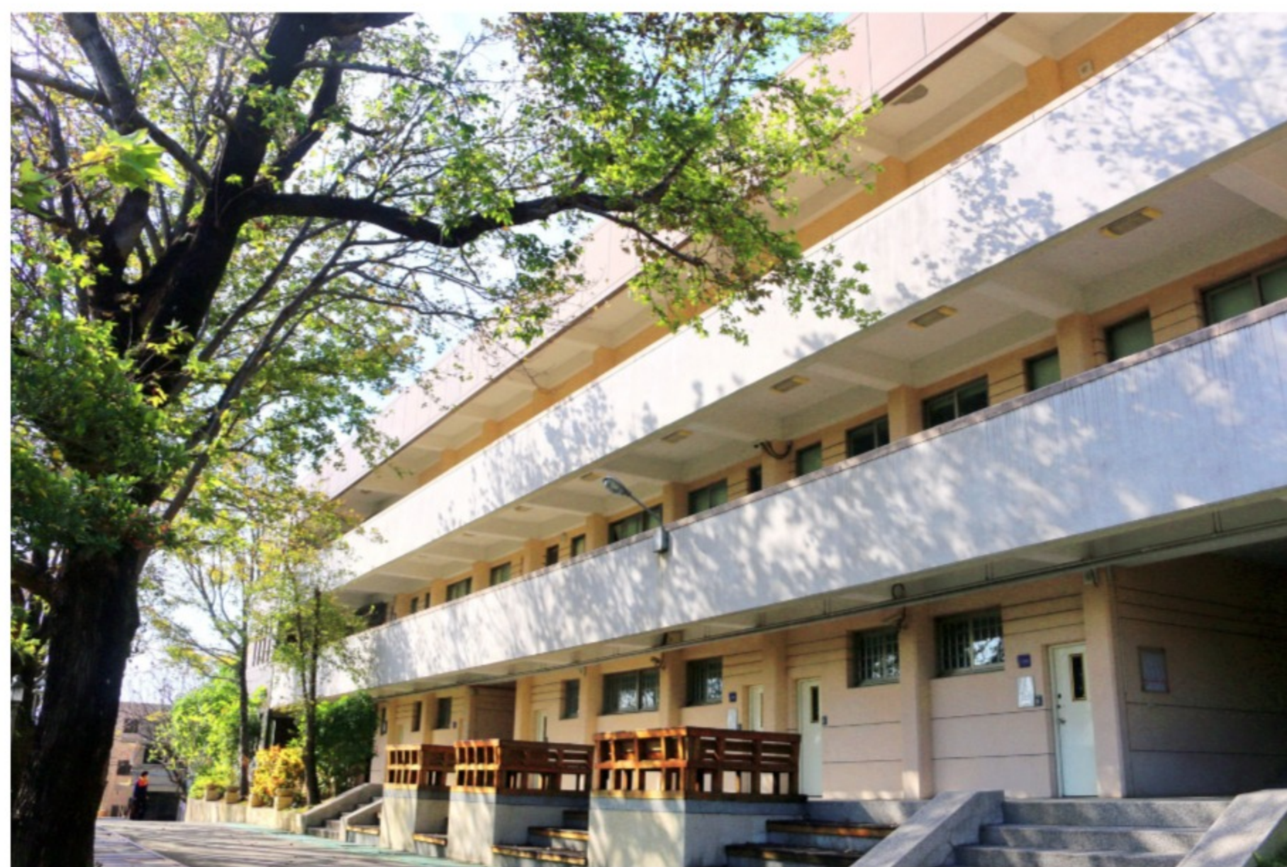
對於視障學生的教室環境安排，光線應盡量充足，座位也應配合弱勢學生的需要

學校資源教室依據輔具評估結果及實際需求，申請或採購盲用電腦、掃描器、點字書、錄音教材、文字轉語音軟體等提供使用。