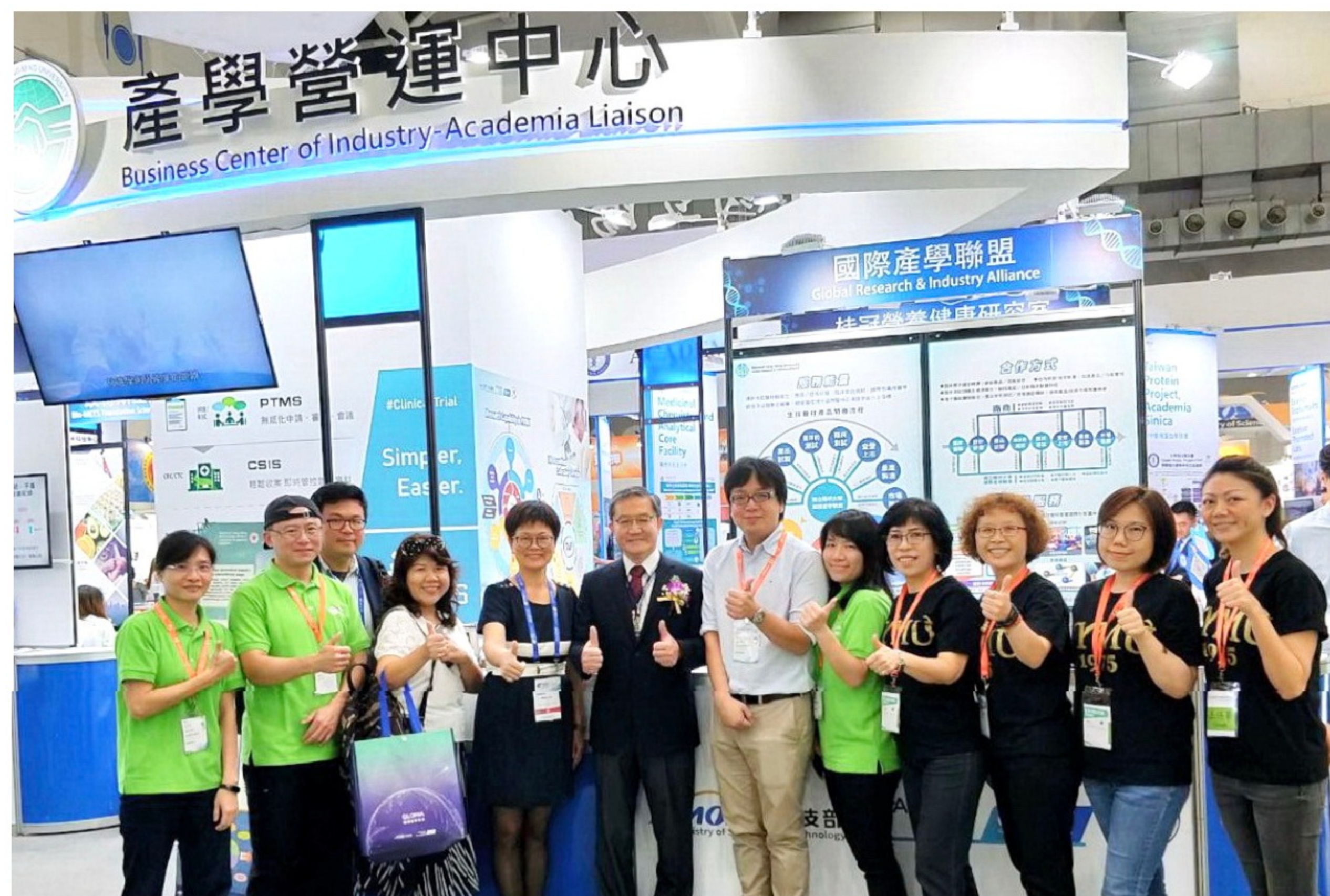
最具規模與專業的「國立陽明大學主題館」

亞太地區最大的生物科技展——2019亞洲生技大展（BIO Asia-Taiwan Exhibition），今年首度由美國移師台灣，並與「台灣生技月BIO Taiwan」聯合舉辦，規模創下歷年新高，共有超過25個國家地區、60間國內外上市櫃企業與1700個攤位參與盛會。「陽明產學營運中心」也打造最具規模與專業的「國立陽明大學主題館」，於「台北南港展覽館一館N525」隆重登場。