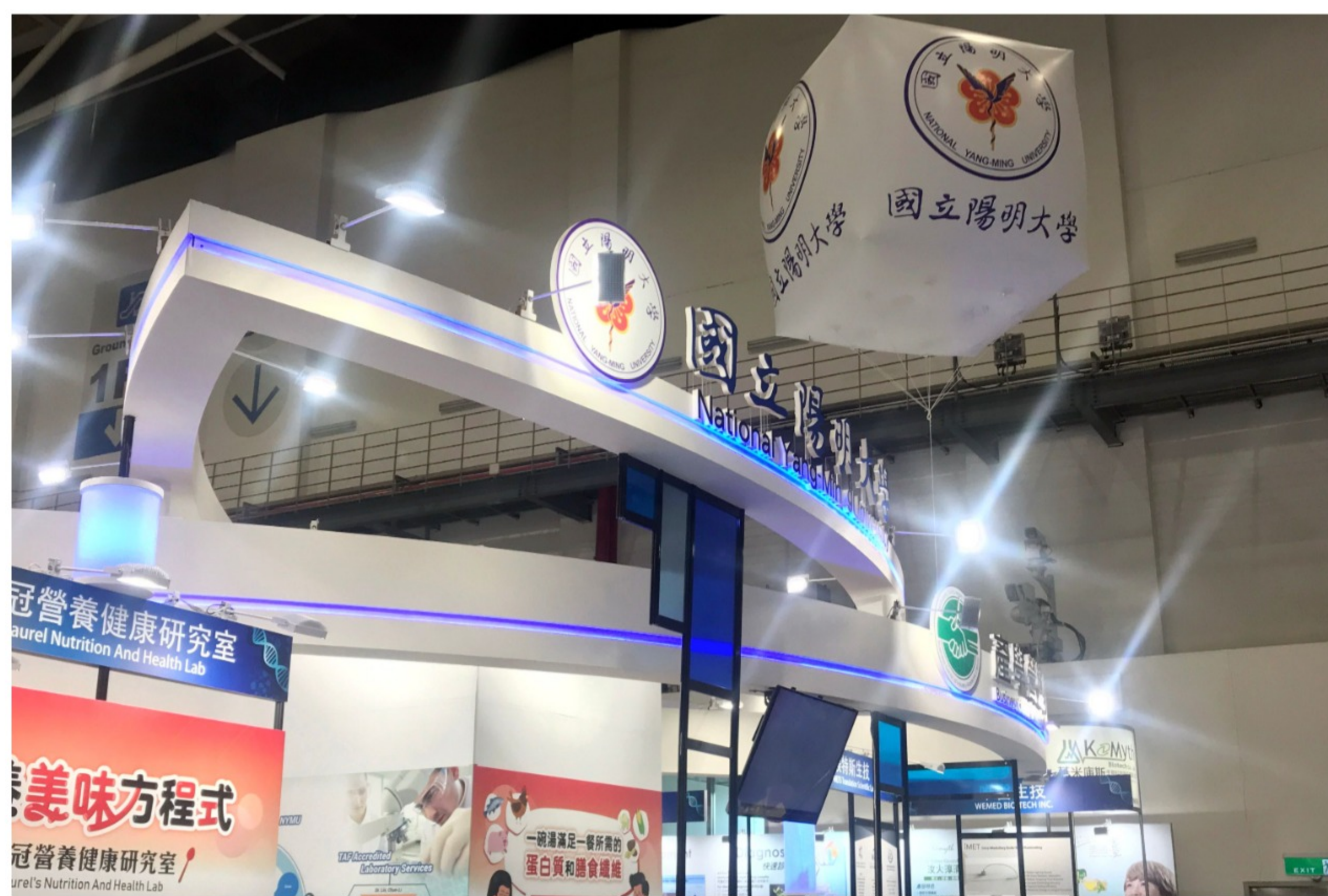
透過亞洲生技大展的平台，陽明期望增加更多技術媒合的機會

陽明產學營運中心打造的主題館，帶來最新生醫研發成果，讓學術能真正應用在產業上，期盼透過亞洲生技大展BIO Asia Taiwan平台，讓研發成果獲得更多曝光，增加更多技術媒合的機會。現場將提供獨家優惠訊息，歡迎蒞臨指導交流。