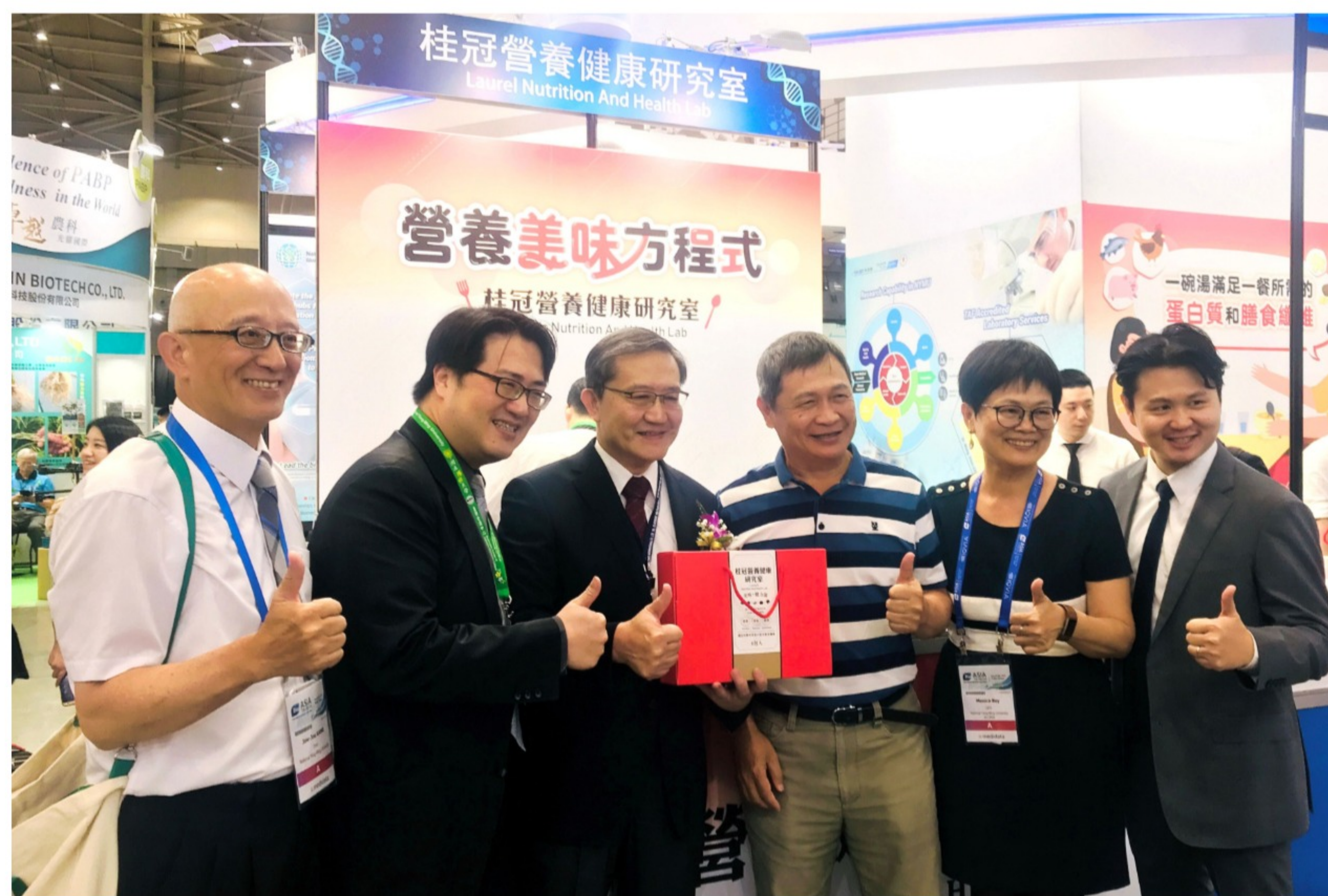
陽明與桂冠產學合作的「桂冠營養健康研究室」

在陽明大學主題館展區內，可看到與陽明進行產學合作研究的「桂冠營養健康研究室」，運用國健署近年積極推動之「我的餐盤」為概念設計，以我國「每日飲食指南」為原則，針對蛋白質攝取量來進行臨床試驗，預期將有助於肌力與肌肉量的提升，進而改善體況；同時也展示研發出來的美味營養湯品，給消費者全新選擇。