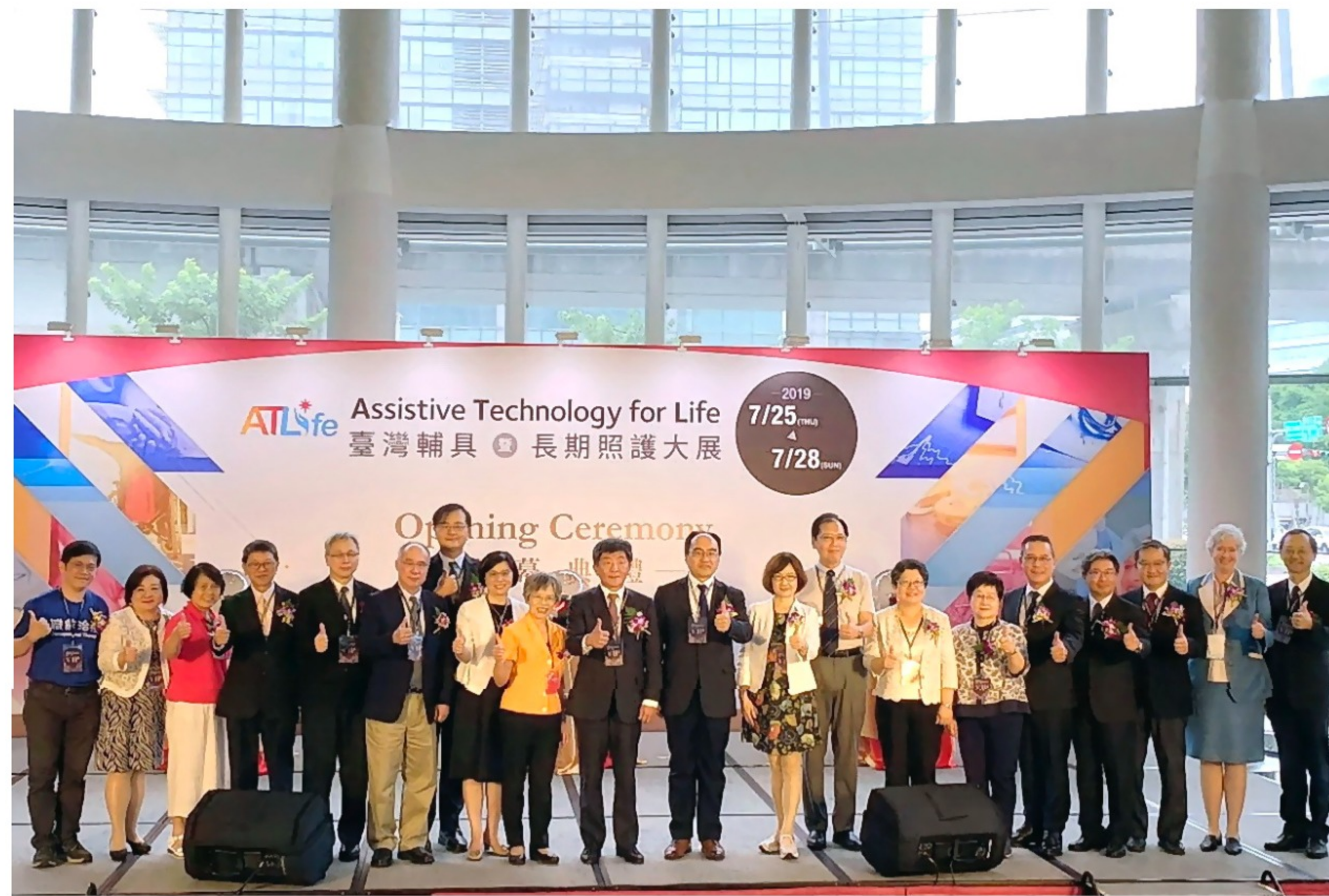
「臺灣輔具暨長期照護大展」是唯一以輔具及長照為主軸的國際專業展會

由陽明ICF暨輔助科技研究中心主辦的「2019臺灣輔具暨長期照護大展」(ATLife)，是臺灣唯一以輔具及長照為主軸的國際專業展會，7月25至28日在南港展覽館一樓盛大登場，展出多種國內外最新居家、醫療照護輔具及運動復能器材。4天展期中，由專業人員現場提供輔具評估及使用訓練，以及衛教、政府補助諮詢等多項服務，服務規格超越德國REHACARE和日本HCR輔具展，共吸引11萬8798參觀人次，較去年成長40%。