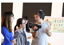
藝術家教導同學攝影