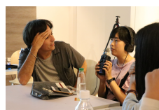
大家體會自己錄音時的聲音

在最後一天的工作坊，同學們也分成兩組實際去拍攝。大家以植物為主題，透過不同的構圖、鏡位變化，呈現腦中想要的畫面內容。之後，藝術家再從旁教導同學如何利用手邊現有的材料，如：投影機燈光的投射、搭配不同色彩或文字的投影片、不同材質物品所造成的反光效果，以此來捕捉光影變化，並配合內容營造氛圍。