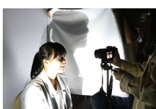
練習捕捉光影變化