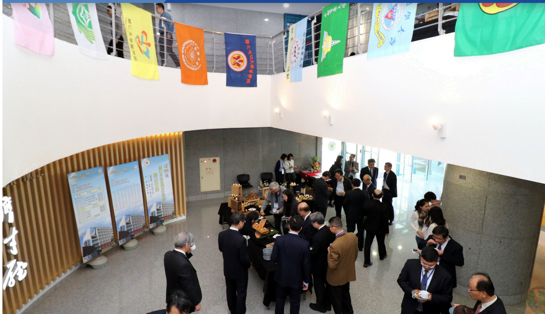
與會人士於鷹才廳外進行交流