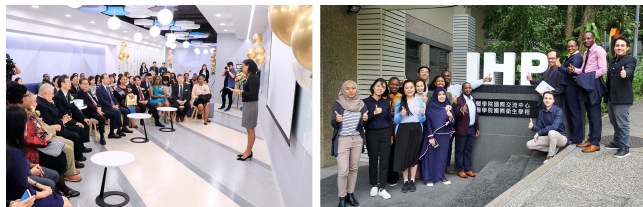
開幕式貴賓宴集，並由國際生擔任主持與接待（左圖）；陽明現有國際生以就讀國際衛生學程的人數最多