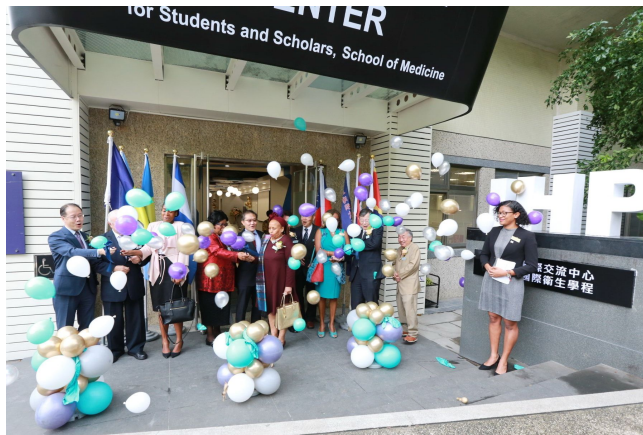
「國際交流中心」邀請駐華使節、與會貴賓及陽明師長共同揭幕

陽明近年積極致力於國際化，第一座專為國際生打造的全新空間——「醫學院國際交流中心」，11月25日正式揭幕，將提供更舒適現代的學習與交流環境，讓來自世界各國的學生在陽明美麗的校園裡有全新的學習體驗。開幕式同時邀請貝里斯、史瓦帝尼、尼加拉瓜、聖露西亞、聖文森大使館使節參加，共同見證醫學院國際交流中心的誕生。