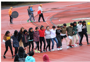
「15人16腳」女子組冠軍牙醫隊

各項比賽隨即熱烈展開，本屆運動會一如往年共有23項徑賽、8項田賽，以及員工兩項趣味競賽。雖然天公不作美，在視野遼闊的山頂運動場上，放眼望去，仍是一張張活力洋溢的笑臉，時時傳來熱情激動的加油吶喊聲。