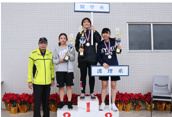
女子田徑總錦標前三名

醫學系在男子4000公尺大隊接力賽中，一起跑便領先群雄，但每一棒仍奮力向前，即使領先兩圈依舊不放鬆，也讓現場氣氛為之沸騰不已，最後果然不負眾望奪下第一。有些院系因人數不足，女生也下場與男生同場競技，精神實在可嘉。