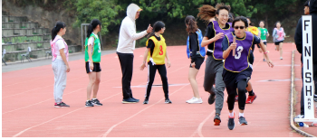
女子代表隊大隊接力拚勁十足