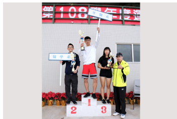
男子田徑總錦標前三名