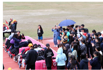
場邊觀眾熱情地加油吶喊

最受歡迎的「15人16腳」，雖然不少同學起跑後即跌跤、絆倒，但不管成績如何，大家仍跑得樂不可支，場邊加油的觀眾也看得樂開懷。護理系在女子組雖僅名列第四，但在男子組卻以娘子軍為主的班底，跑出今年最佳成績15秒88，與往年冠軍紀錄相比也名列前茅。當她們以整齊的步伐一路快速跑向終點，令場邊觀眾幾乎傻眼。