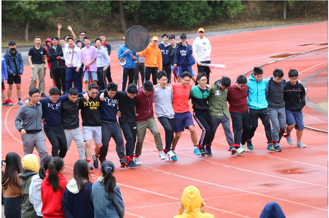
雖然天氣不佳，今年第45屆校運會依然熱力十足、歡笑不斷

今年校運會可說是有史以來最冷的一次，強勁的東北季風不斷迎面襲來，綿綿細雨也幾乎整日不停。儘管風雨交加，海拔165公尺高的山頂操場上，依然活力洋溢，熱力十足。參加的選手們個個開心競技、同樂——青春、活力、歡笑，為第45屆校運會美好封存！