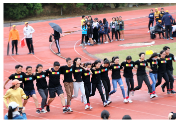
「15人16腳」男子組冠軍護理系