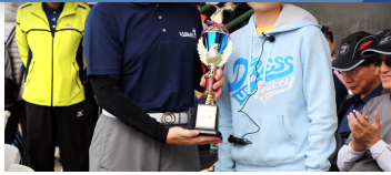
醫學盃女子羽球亞軍呈獻獎盃