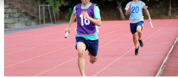
4000公尺接力賽，醫學系領先兩圈依舊不放鬆

上午壓軸的校隊代表隊大隊接力，與下午最後一場比賽——男子4000公尺大隊接力，同樣吸引大批觀眾圍觀、加油。校隊代表隊成員本來就體力過人，在校運比賽同樣拚勁十足，非常吸睛。去年冠軍男籃隊，今年仍然爆發力驚人，也再度奪冠。