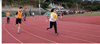
競爭激烈的大隊接力，男女同場競技