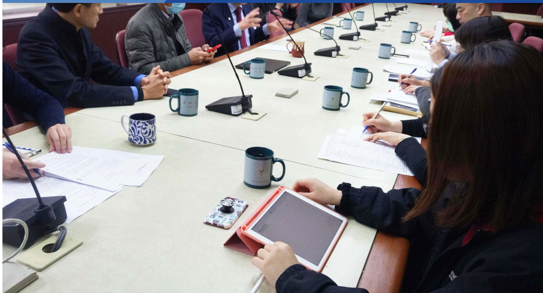
本校防疫小組2月3日召開會議，確認校內防疫體系與組織編制