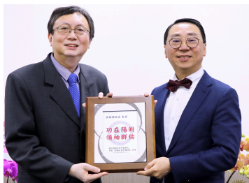
張院長（左）頒贈感謝牌給許前院長