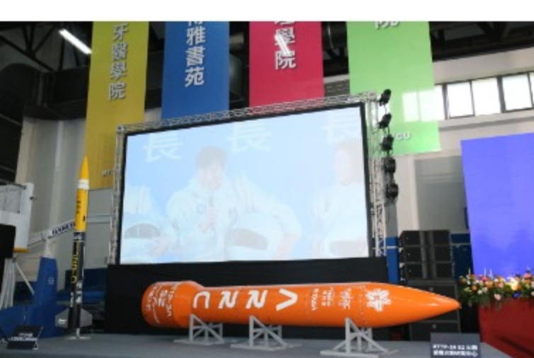
現場展示了今年成功發射的火箭，以及曾參加COMPUTEX展出的方程式賽車。