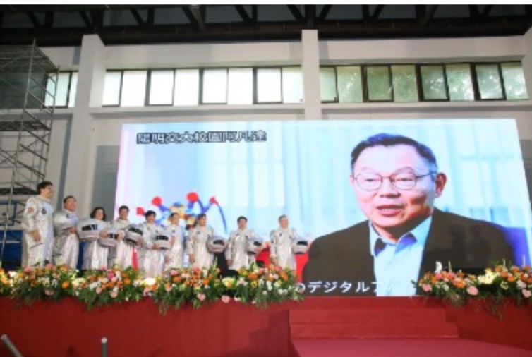
林奇宏校長率領一級主管著太空裝現身，並展示學校自主研发的阿凡達（avatar）數位分身，並以中、英、日三種語言向2060名新生致以歡迎。