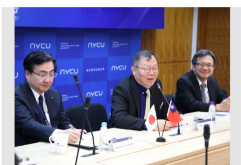
東北大學來訪本校深化台日合作，同時也更新合作備忘錄。