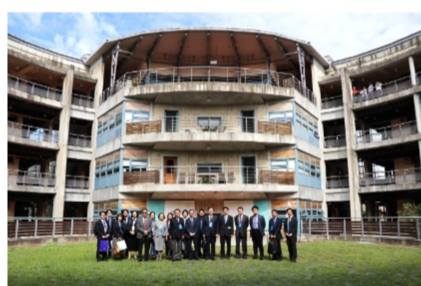
參訪六家校區客家學院