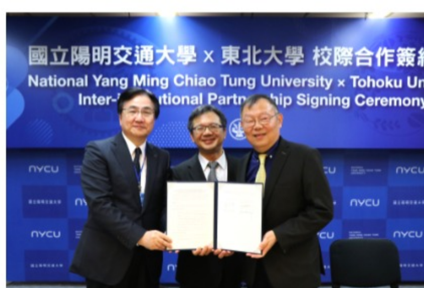
雙方自2005年締結合作以來，已建立多層次的交流結盟，此次再更新合作備忘錄。