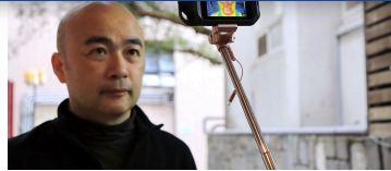
紅外線儀能遠距、快速量測體溫