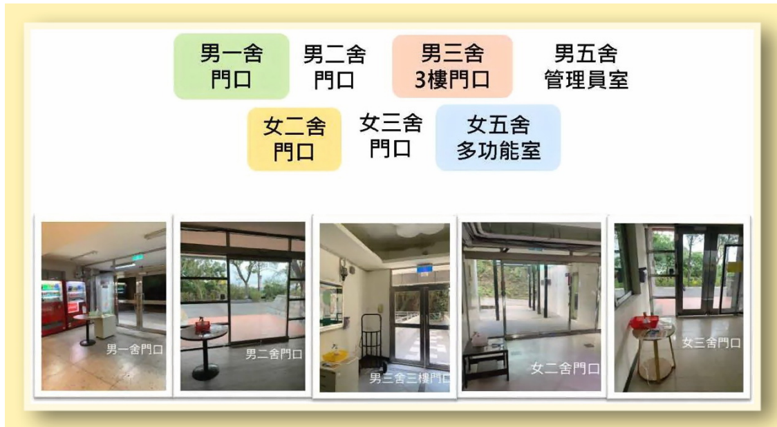
位於宿舍區的額溫量測站

防疫小組再次呼籲，全校師生應做好個人防護與健康管理，每天注意體溫與健康狀況，勤洗手和注意咳嗽禮節，保護自己也保護家人，並落實生病在家休息、不上課的原則。在校內如有發燒現象，或咳嗽、呼吸急促等呼吸道症狀，請於系統登錄回報 ( https://forms.gle/JiVmkKGyhhgASRjy6 )，衛保組護理師將透過電話關懷並協助您。如有任何問題，請與衛保組聯繫，電話28267212， hcchang@ym.edu.tw 。