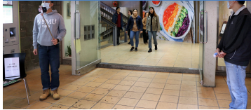
學餐二樓門口備有紅外線儀與耳溫槍兩種量測工具