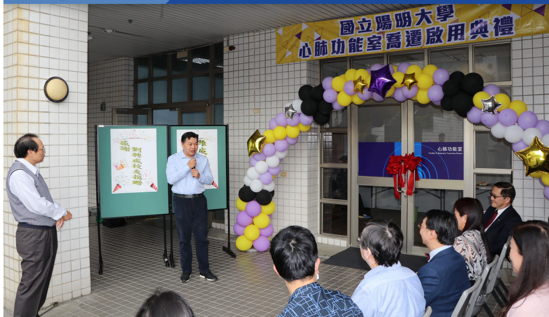
啟用典禮除邀請劉校友致詞，牙醫學院及校內多位主管、師長也親臨參加