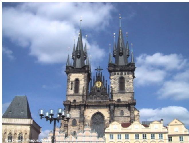
舊城廣場上的泰恩教堂