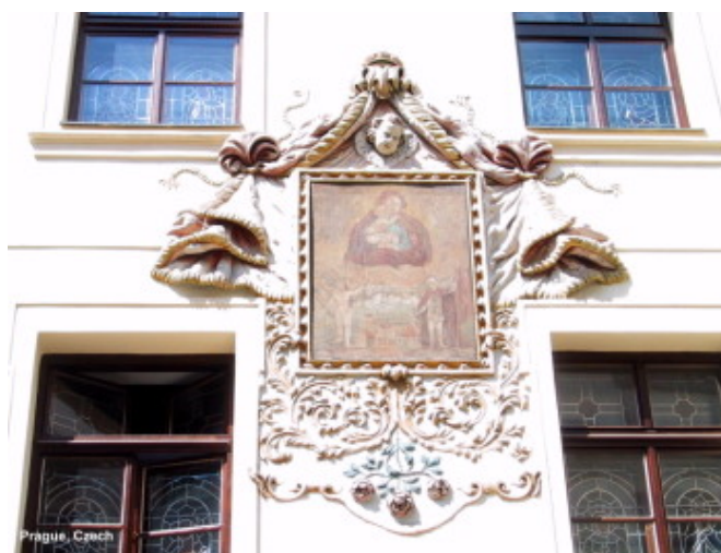
在這藝術城市裡，美麗的樓房與牆上的灰泥雕飾 將使你目不暇給。