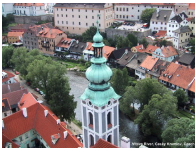
Vltava河最美麗的一段——克倫隆