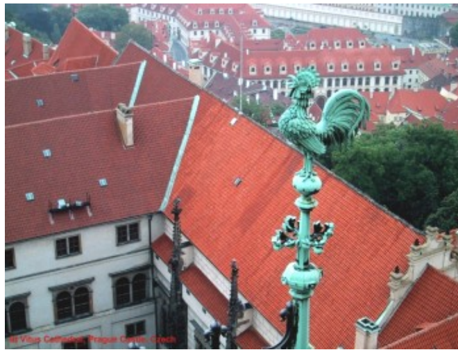
從聖維徒斯大教堂鐘樓頂鳥瞰布拉格城堡區