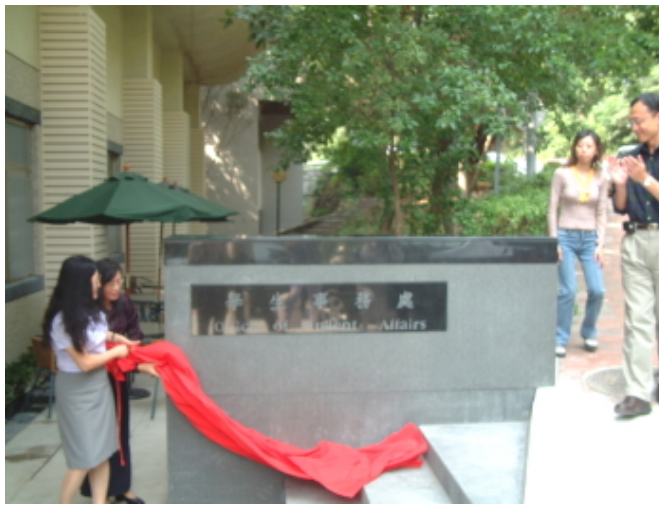
校長為學生事務處新居揭幕