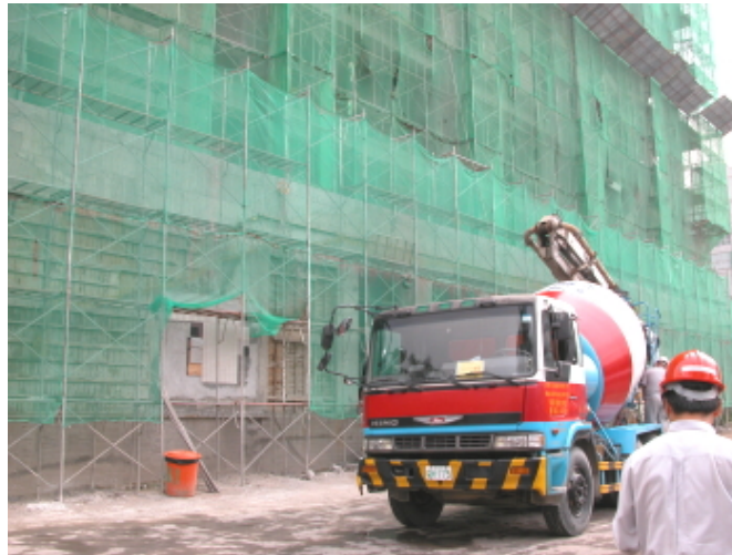
圖資大樓工程進度都能超前完成

別設計樓頂承雨面的樓板配管要走明管，以減少未來維護時的困擾。從小處著眼，可看出總務長謹慎將事的細膩心思。