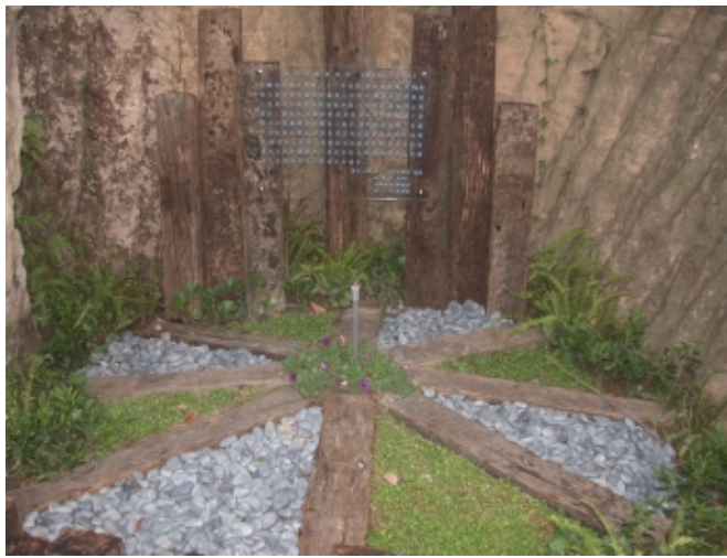
枕木步道的修整使得行走無礙