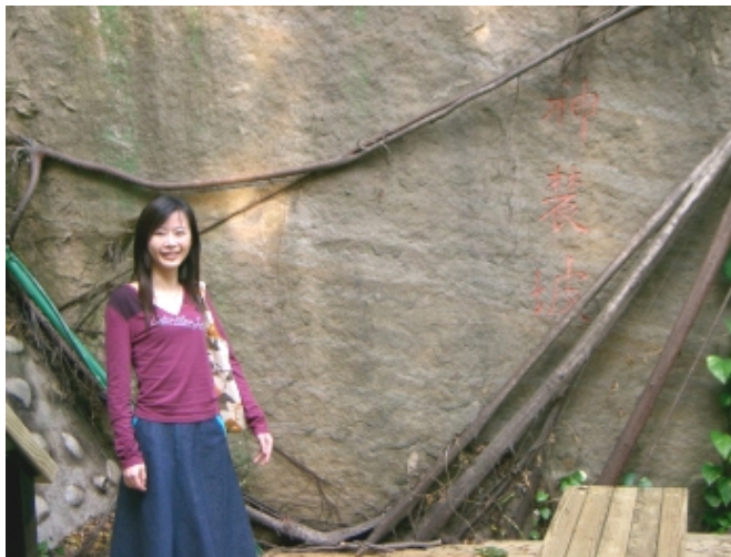
神農坡呈現的是陽明的精神象徵