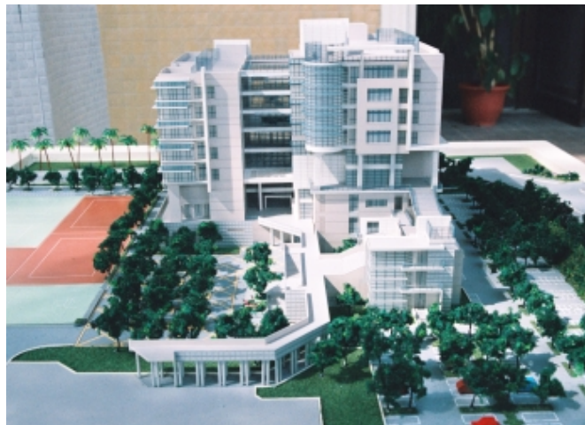
圖資研發大樓模型

「我最初的想法，是蓋一棟不會漏水的大樓。」宋總務長直截了當地說出他對興建中圖資研發大樓的期待。