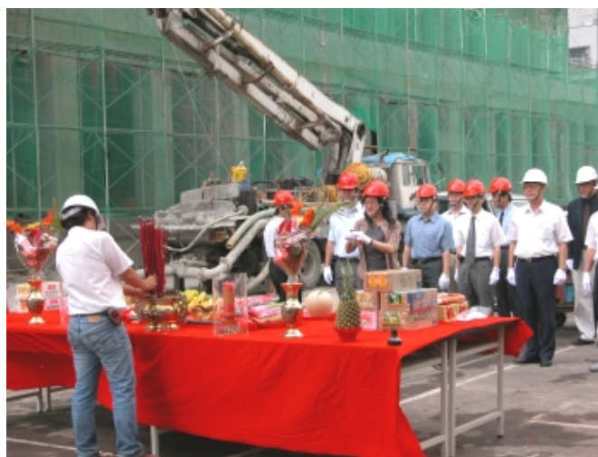
上樑典禮由校長主持

一踏進陽明大門，道旁的圖資大樓工地便巍峨在目，這棟預計在明年五月即可完成驗收的大樓，樓高九層，地坪約7100坪，自92年3月開工破土，歷經14個月，於今(93)年5月28日舉行了上樑典禮，象徵著建築的主體業已完成。