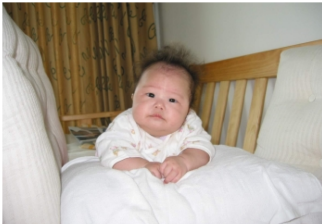
總務長的千金對他的表現給了一句評語： Hum, daddy, not bad!