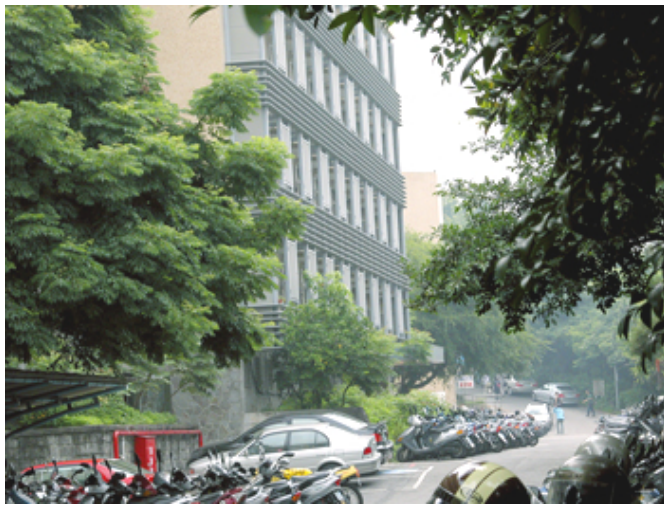
在加裝了遮陽板以後，學生宿舍風格變得新潮而具有現代感