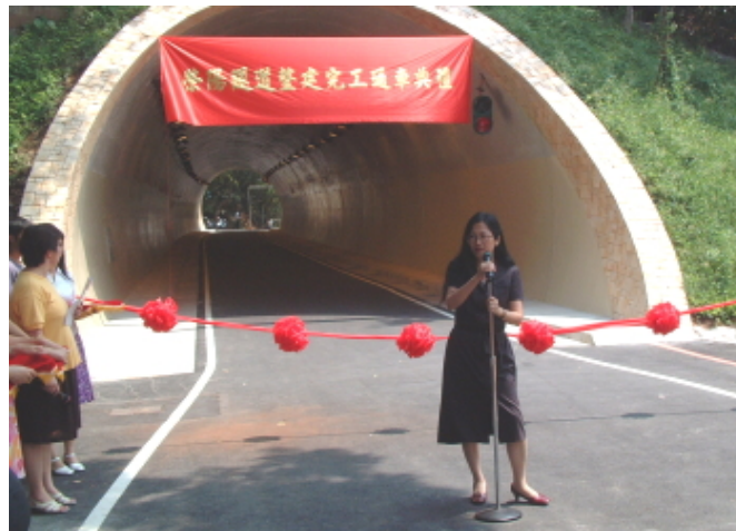
校長在隧道通車典禮上致詞

總務長只得運用行政措施，訂定每週開會，不但檢討前週的工程進度，也預訂下週的里程。這樣勤於溝通的結果，監造單位建議改採替代工法，營造團隊調整施工順序，於是乎，原本嚴重落後的工期，硬是給拉前了進度，終於趕上預訂通車的日期。