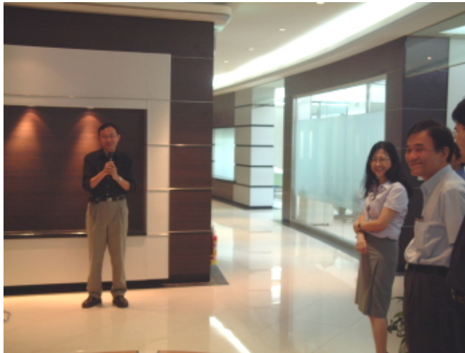
學務處的燈光和環境非常柔美