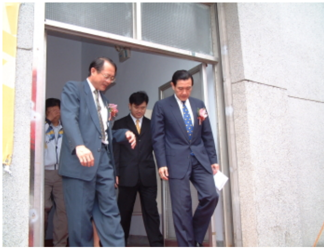
大樓落成當天宋總務長（右二） 陪同馬英九市長剪綵並參觀內部設施