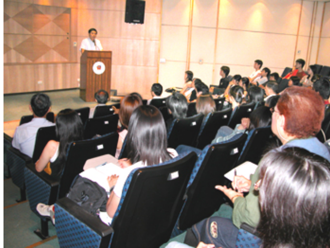
當日聽眾除了本校師生外，社區居民也慕名而來

關懷就像加值的服務，鑽石經過精心雕琢，價值立即浮現；愛心加上關懷加上回饋，它的加值是難以想像，而它的成就感更是令人永難忘懷。