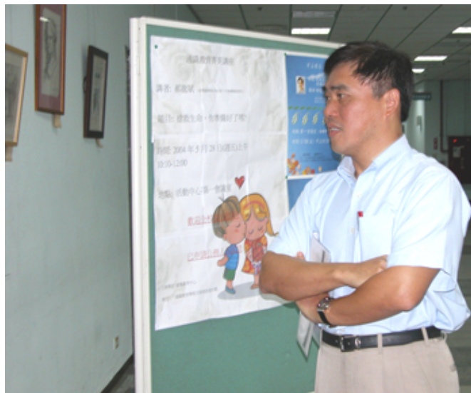
郝秘書長蒞臨本校活動中心演講

郝秘書長這天是應通識中心邀請，為全校師生演講〈搶救生命，你準備好了嗎？〉一小時的演講過程中，郝秘書長既無講稿，也未準備投影片，完全以幽默風趣的言語和生動活潑的風采，緊緊攫取聆聽者的注意力。但真正令人動容的是，他以親身的歷練，剴切陳述自己對生命的熱忱和服務的人生觀，因為真心誠懇，所以能不斷迴盪出感染的力量。以下便是他當日演講的部分摘要：