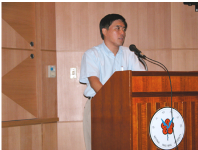
郝秘書長以自身的經歷應證服務的真諦

在老人居家服務方面，我們招募大專志工，施以簡單的訓練後，讓他們去照顧獨居老人。有一位22歲的大專同學，幾個禮拜前第一次去服務，事後他對我說，一走進去他就後悔得想溜，因為裡面又髒又臭，但是行動不便的老人看到他去表現得那麼高興，他不好意思打退堂鼓，想說反正已經來了，就做完這一次吧！以後做不做再說。