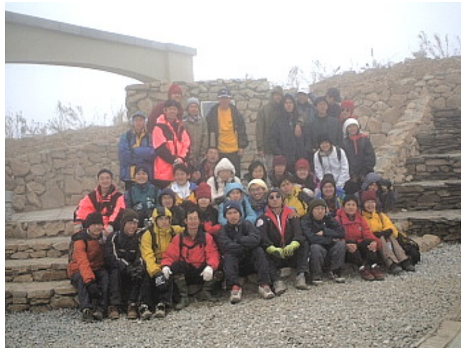
(圖·文 / 課輔組·左智慧)