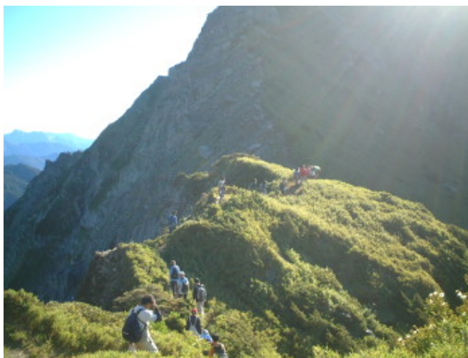
讓我們迎向朝陽的萬丈光芒

6月25日早上五點三十分開始背著重裝走向營地 - 成功山屋，約三個半小時到達；之後，我們就無所事是，享受了鮮少有的空間，什麼事都不用做，就只是看山、看雲、聽風、曬太陽、話家常、吃東西，這樣的時光還真是幸福呢！