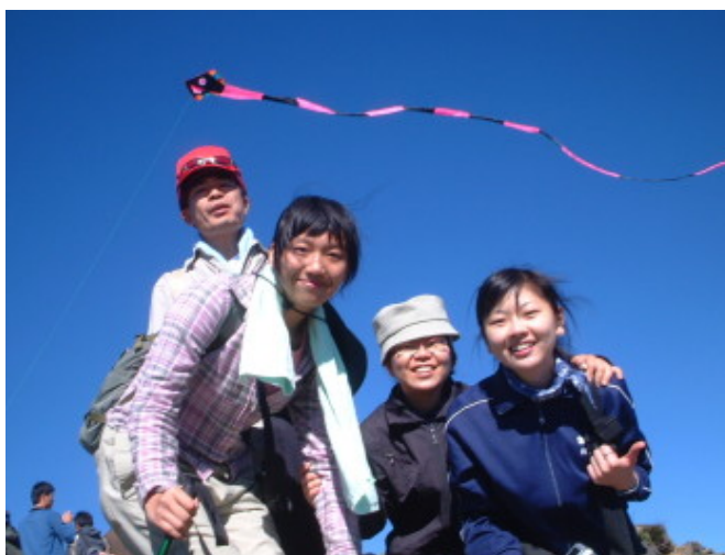
以飛揚的風箏慶賀登頂成功

6月26日早上六點，我們愉快又滿足的走出山林，回到真實的生活世界。回想起來，我們真的真的很幸運，天氣那麼好，沒有下雨，又沒遇上颱風，而且是74人完成此次大山活動，這可說是登山社輝煌的歷史紀錄呢！