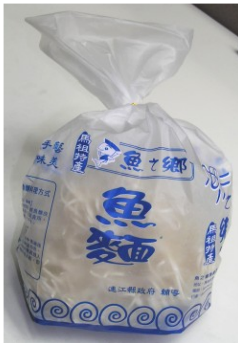
很多人因為不諳馬祖魚麵料理方式，會感到魚腥味重；其實料理得法，魚麵是很芳香可口的