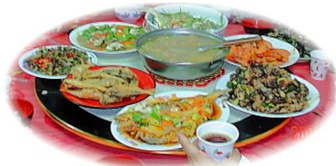
大眾小吃店的老闆娘，隨時都能快炒出一桌好菜