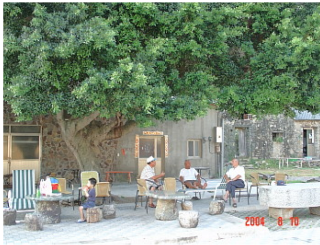
這棵老榕已有百年歷史，村民都喜歡在樹下納涼