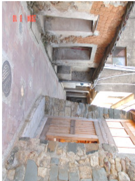
曲折小巷饒富古意