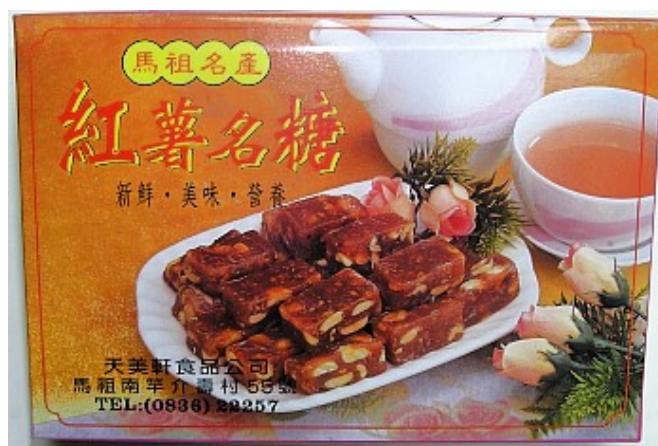
天美軒的紅薯糖，以及冬天才賣的糯米糖，都是值得推薦的傳統口味