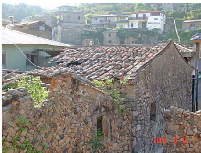
馬祖很多民宅因為人口外流而破落