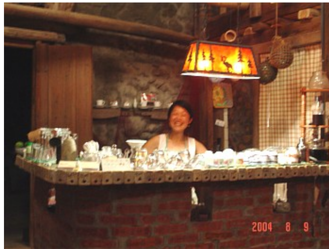
老闆夫婦動員家族人力 費時八個月胼手胝足將老家翻修而成