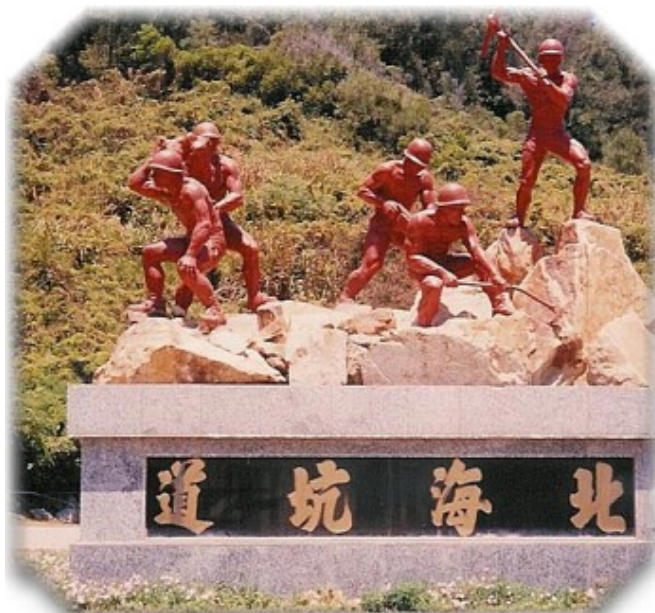
民國57年完成，可提供戰時百艘登陸小艇停放