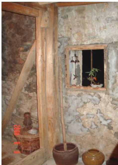
內部裝潢盡量維持傳統特色