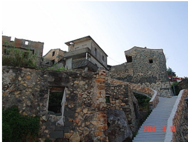
馬祖的魚村多半依坡建築，右上角的房子是有錢人住的