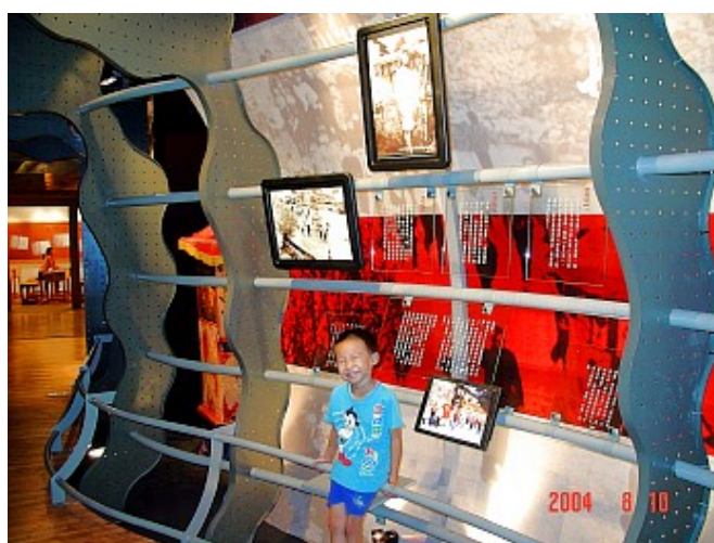
館中陳列的照片述說著馬祖過往的民俗風情