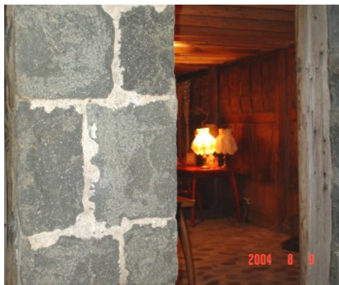
在這裏喝咖啡，可以仰望星空和港口夜景，感覺非常浪漫