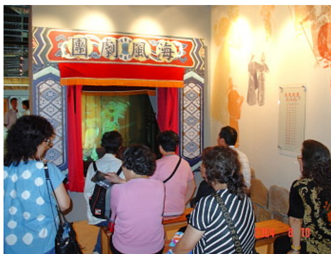
海風劇團看福州戲