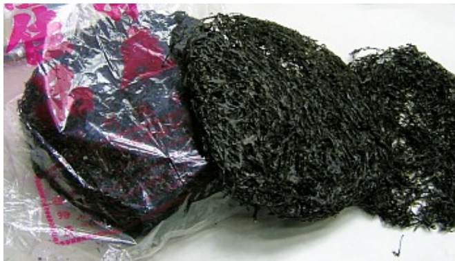
紫菜分為冬菜和春菜，以冬菜為上品。紫菜用來煮湯、麵和涼拌，都很美味