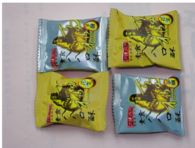
八八口酥的個別包裝，很適合攜回送禮