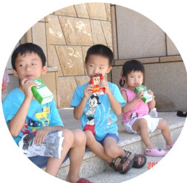
呼，終於看完，可以喝飲料了！