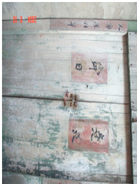
老式的木門，讓人墮入時光隧道