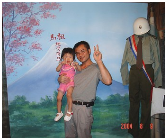
因老闆原開設照相館，咖啡館中設有照相陳列館，可以體驗一下在馬祖當兵退役前特至照相館留影的情形