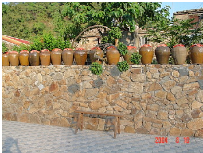
津沙村為閩東文化村的預定地，目前硬體正在整建中