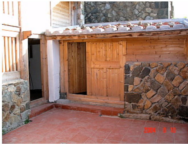
房子經過維護就立即煥然一新