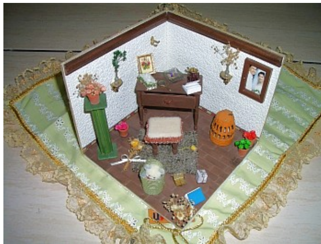
這不是紙黏土，是我另外做的袖珍作品