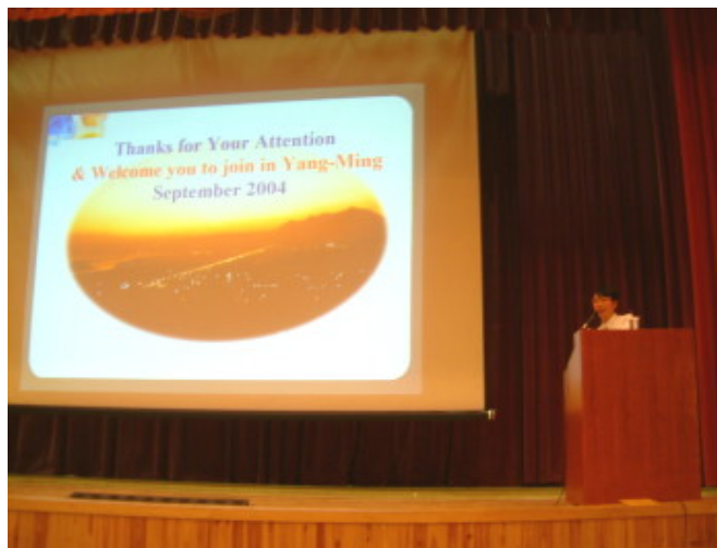
歡迎你們加入陽明