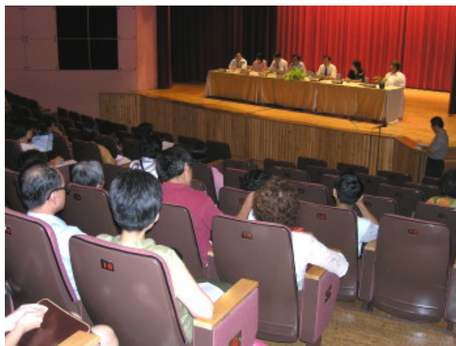
高主秘代表校長致歡迎詞

會前即發送每位家長一份參考資料，上面載有關於宿舍管理與服務、交通安全防護措施、防止各式詐騙行為、心理諮商與輔導，以及軍訓室24小時值班電話等簡要說明。