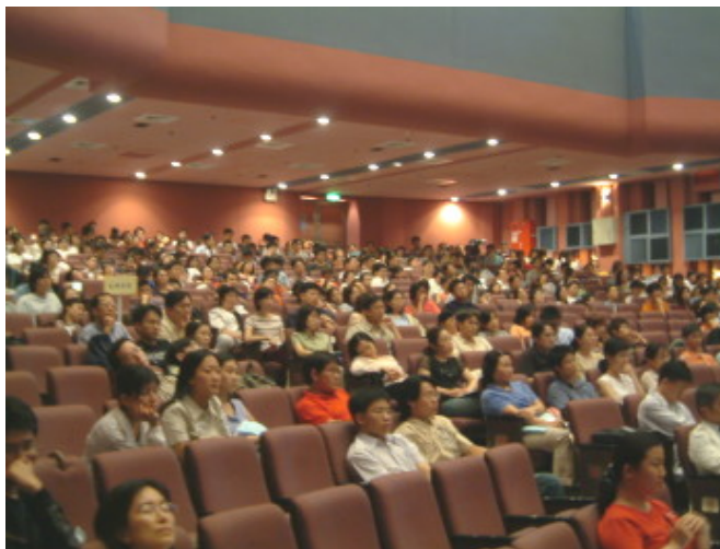
今年參加新生入學指導的研究生相當踴躍