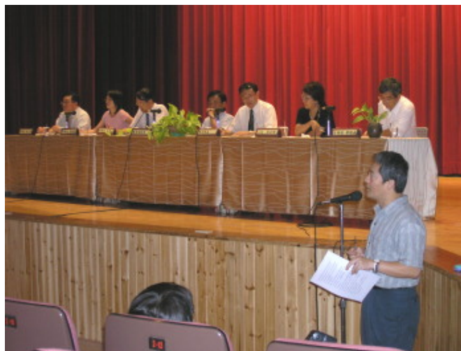
吳組長說明學生宿舍的申請辦法

為了讓家長們對陽明多所認識與瞭解，學務處於七日下午二時開始，在表演廳舉辦新生家長座談會。