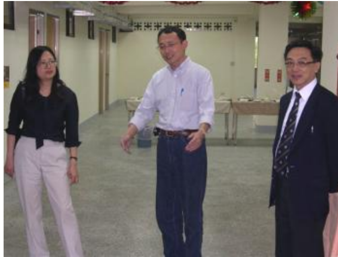
黃學務長介紹學程新家的環境