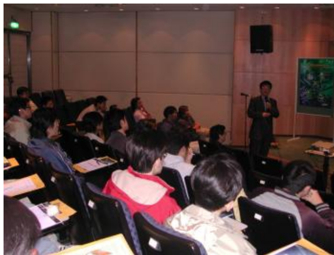
參與同學專心聽講

活動結束後，參與同學仍把握難得之機會，向與會的工研院代表及校友提出詢問，整個座談後就在此和樂的氣氛中落幕。