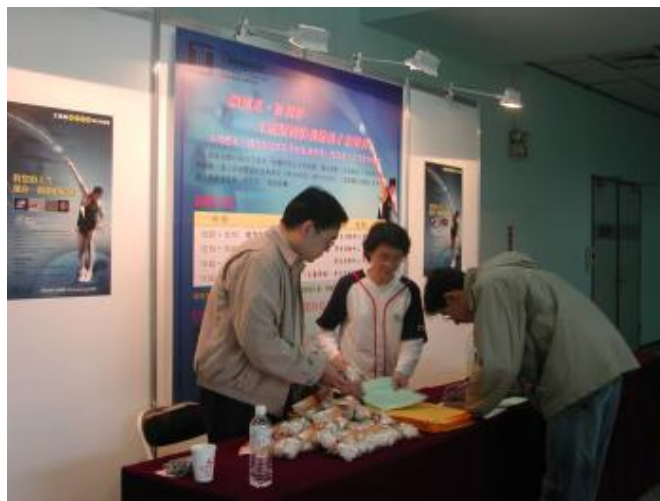
參與的同學簽到中