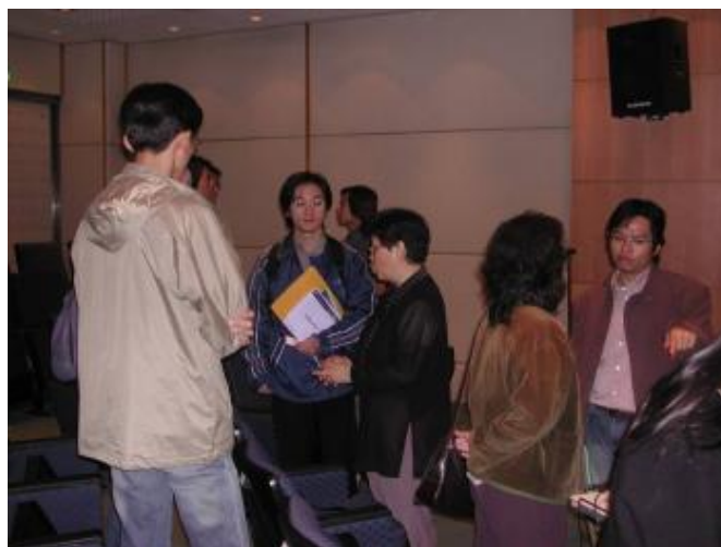
結束後，同學仍繼續詢問中

活動結束後，參與同學仍把握難得之機會，向與會的工研院代表及校友提出詢問，整個座談後就在此和樂的氣氛中落幕。