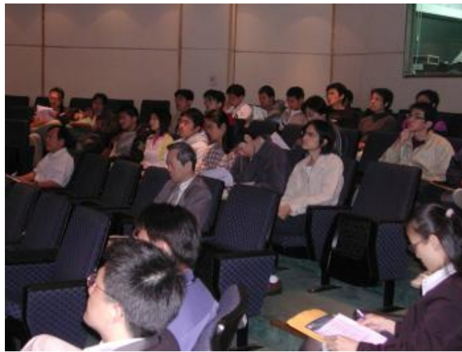
參與同學專心聽講