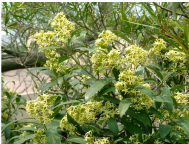
錦蘭，夾竹桃科。本校常見藤類之ㄟ。平時掛在樹上、岩壁上沒人理睬，春季開花時滿樹黃綠色花球，常吸引登山客好奇採花觀看。盛開時常吸引許多蝴蝶、甲蟲吸食，如黃星鳳蝶等。葉片是端紫斑蝶、蛾類幼蟲食草之ㄟ。