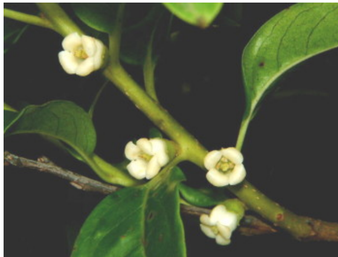
山红柿，柿樹科。本校常見喬木之Ⅰ，數量不少。清明前落葉，清明時長出新芽，清明後從枝夜間開花，數量不少，因此結的果實也不少。果實冬季轉成橘黃色，相當搶眼，是賞花賞果的植物之Ⅰ。