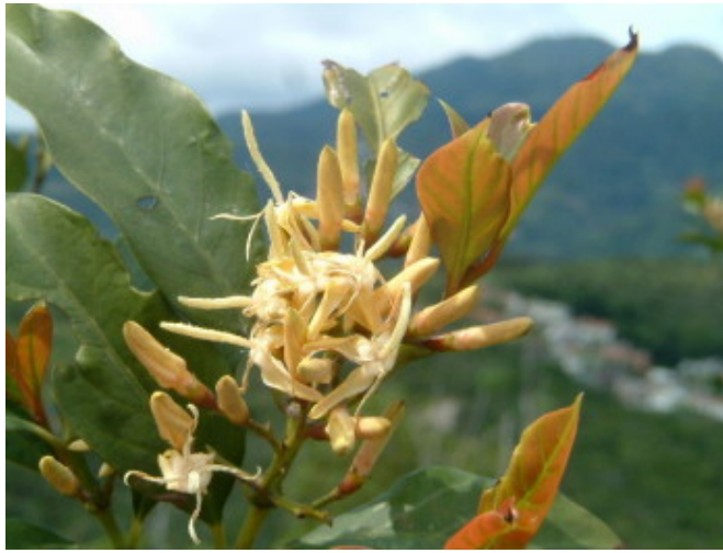
茜草樹，茜草科。本校常見植物，一年春秋兩季盛開。春季盛開時常吸引大量昆蟲吸食花蜜或採花粉等。春天 賞蟲時，找一株盛開的茜草樹守株待兔，幾乎可以把本校常見的吸花蜜昆蟲都瀏覽過一遍，尤其熊(花)蜂類最愛 穿梭花朵間把身體搞的一身粉白。