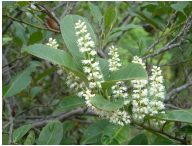
小花鼠刺，虎耳草科。本校常見植物之Ⅰ，春秋兩季開花。白色花串如瓶刷，相當好認。盛開時常吸引昆蟲吸食花蜜，喜歡金龜類甲蟲的人找一株盛開中的小花鼠刺來觀察，收穫一定不少。