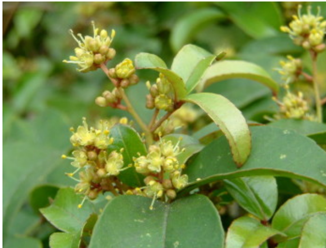
雙面刺，芸香科。幼株葉片常見排列整齊的長刺，老株藤幹的木質化長刺不少，相當好認。一年一開，清明前後盛開。本校常見藤類植物。盛開時常吸引蜜蜂採花蜜。葉片是多種鳳蝶幼蟲食草之ㄟ。