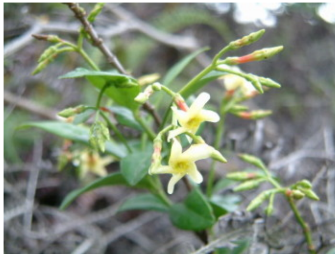
細梗絡石，夾竹桃科。本校常見藤類植物之Ⅰ，常見於岩壁、樹幹、淺土坡面，但要看到他開花必須找斷崖稜線迎風面的植株才看得到。如軍艦岩、唭哩岸山頭等。