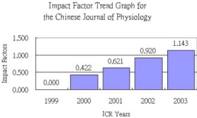
中國生理學雜誌自1999年迄今的論文引用指數 ( impact factor )

生理學雜誌獲得這項殊榮，意味著國內的研究學者多了一個投遞傑出作品的管道，王老師深切期盼國內之生理研究及其他相關領域之學者共同灌溉這塊綠地，讓這塊艱苦開闢之園圃能成長得更為欣欣向榮。