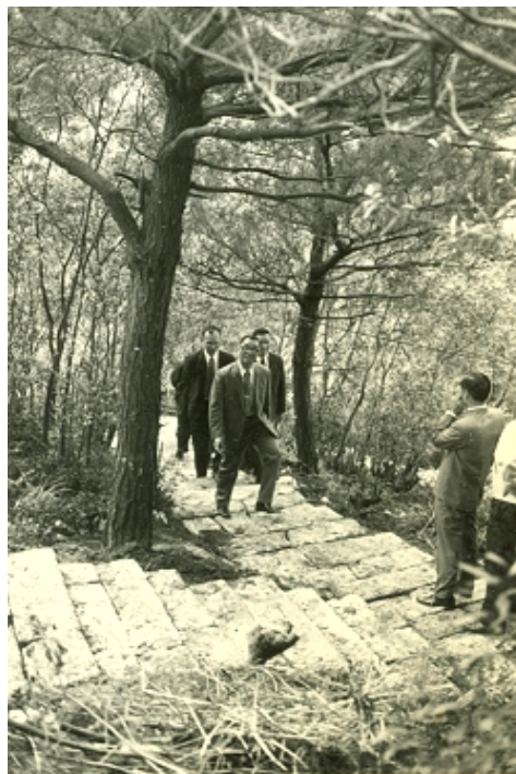
行走在相思樹海間的羊腸小徑，野趣盎然

三十年的歲月在匆忙中過去，遙想當年滿山的相思樹海，一條鋪有石階的羊腸小徑蜿蜒其間，拾級而上，野趣盎然的景致，如今已無法復見。校區從一棟實驗大樓到現在處處矗立著一幢幢的大樓；從華路藍縷到康莊大道，這些都是歷任校長和每一位陽明人共同攜手努力的成果。