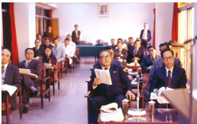
教育部長蔣彥士蒞院視察聽取簡報（1977年）

解剖學科需要在醫學系第二學年上課，而六十四年開院時，科內除主任外，只有一位助教和三位技術人員。我們必須在一年的時間內備妥大體解剖、組織學、神經科學和胚胎學等課程所需教材，記得為了蒐集製作組織學切片所需的器