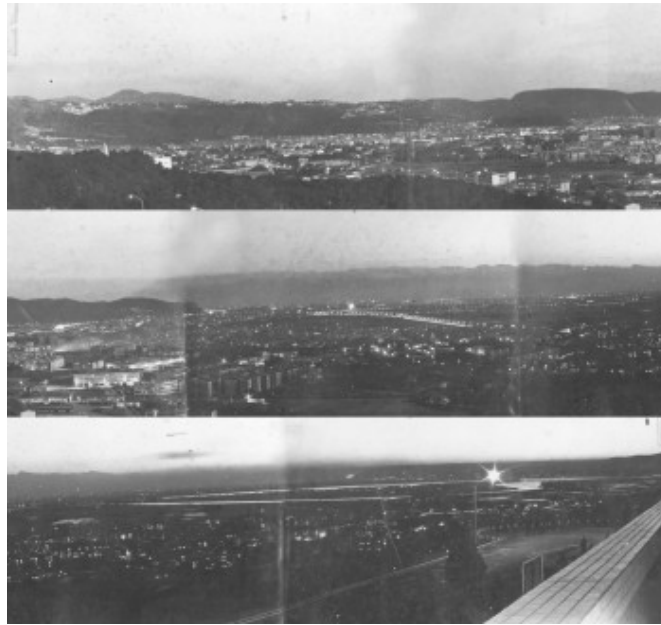
由實驗大樓向外遠眺

三十年的歲月在匆忙中過去，遙想當年滿山的相思樹海，一條鋪有石階的羊腸小徑蜿蜒其間，拾級而上，野趣盎然的景致，如今已無法復見。校區從一棟實驗大樓到現在處處矗立著一幢幢的大樓；從華路藍縷到康莊大道，這些都是歷任校長和每一位陽明人共同攜手努力的成果。