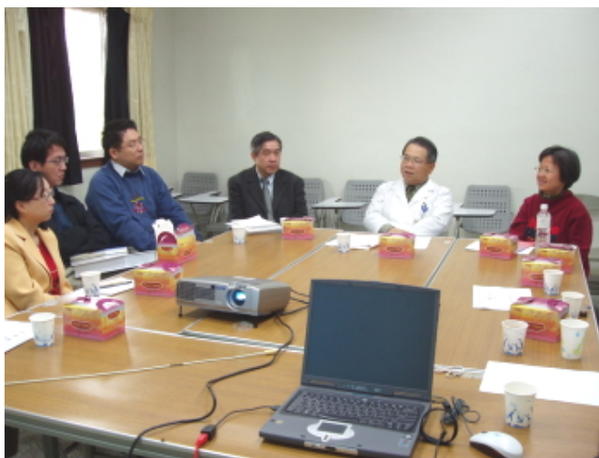
李院長和公衛所教師們交換意見