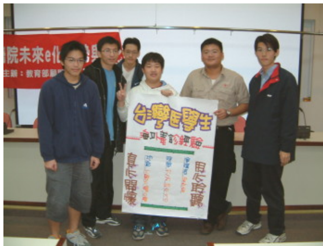
世宗到長庚演講海外義診經驗

以船為交通工具沿著寬廣的亞馬遜河上游行駛，是一種新的體驗。每天日出而作，日入而息，晚上因為沒有光害，可以看到滿天星斗，有人覺得這趟旅程長途漫漫，遙遙無期，因為大部分的日子都過著沒有燈、沒有自來水、沒有電的生活；世宗卻覺得從開始到結束，時間如同飛逝，因為每天都有來自各方面的收穫。他是25天全程參與的團員之一。