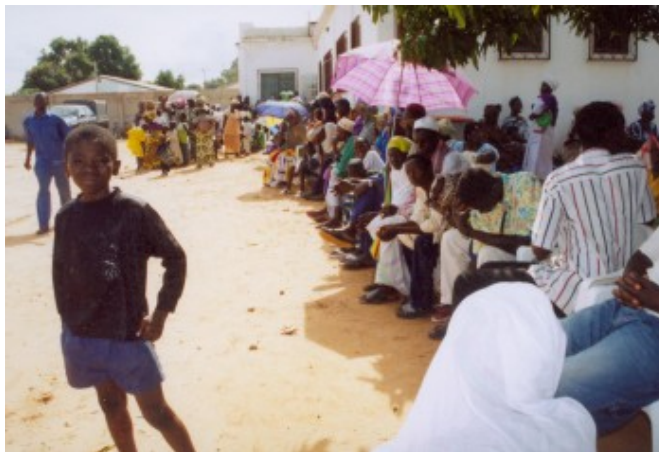
甘比亞等候看診的民眾在酷暑中大排長龍

92年暑假，世宗送給自己一份畢業禮物，他以醫師的身分三度參加路竹會的醫療服務團，這次的目的地是非洲的甘比亞。