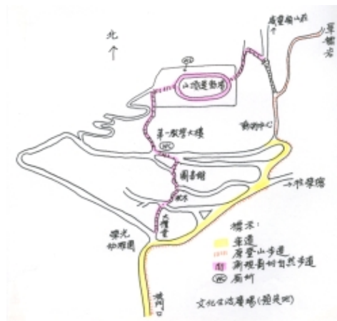
新規劃的自然步道