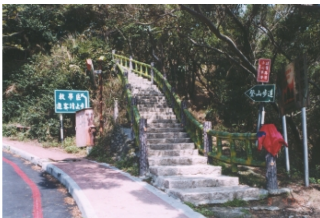
動物中心東側花崗岩階梯步道

目前民眾登軍艦岩最主要路徑全長1170公尺，是從本校校門口沿陽明大學校園汽機車道路旁之紅磚步道，再經動物中心東側之花崗岩階梯步道及磁磚階梯步道攀登至軍艦岩。