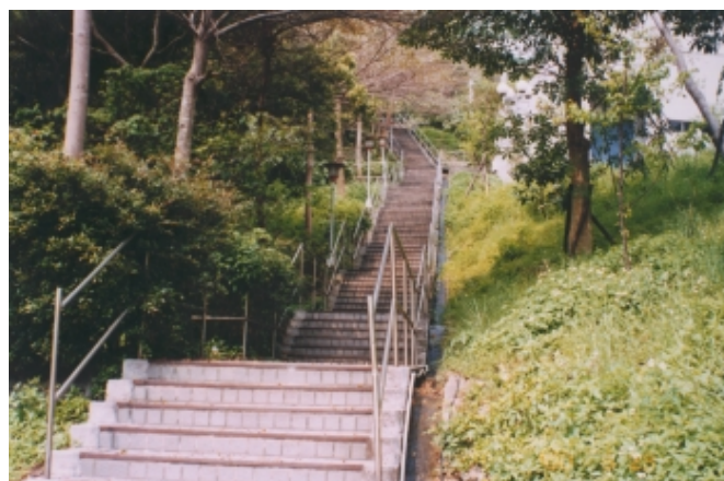
大禮堂西側登山階梯