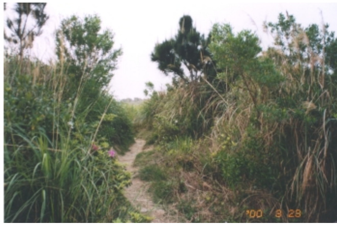
登運動場高點之上坡步道