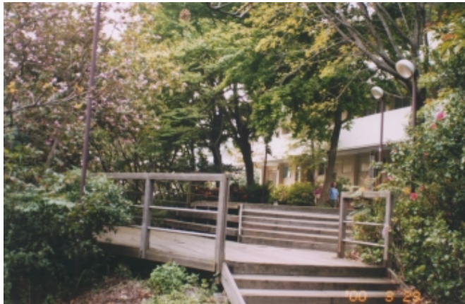
第一教學大樓前觀星台