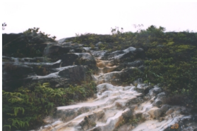
運動場高點往軍艦岩之下坡步道

目前本校正積極籌劃將校門口東側二座舊倉庫及附近約四百坪空間建構為文化生活廣場，此一廣場將包含書局、文具禮品、PC周邊產品、茶館、咖啡屋等商店，方便師生與民眾參與藝文活動、逛書店、茗茶、喝咖啡等休閒活動，以營造「溫馨校園」，提供師生及社區居民優質文化生活環境，而此一文化生活廣場將來可作為各民眾團體攀登軍艦岩活動之集合地點。