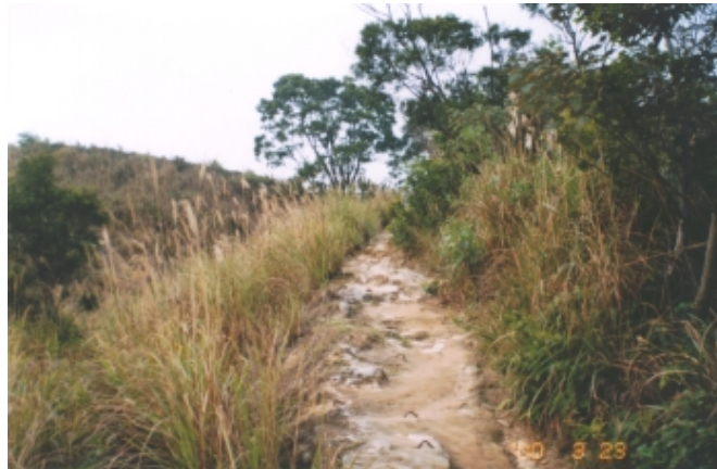
登運動場高點之上坡步道