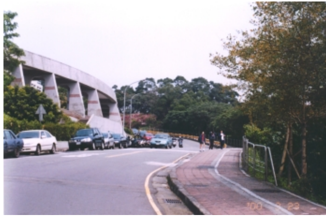
車道旁之紅磚步道