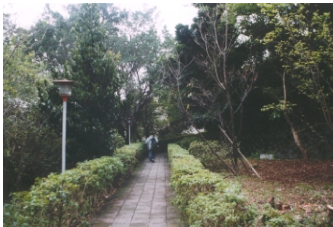
圖書館西南側步道

接著由圖書館西南側步道及西側階梯，抵達第一教學大樓前木製觀星台，亦備有木製座椅三排，一樓男女廁所二十四小時開放，循大樓西側木造階梯往山頂運動場，共有193階，沿途備有木造座椅三處，中段另有木造階梯通往韓園(本校第一任校長紀念墓園)，植有一片櫻花。