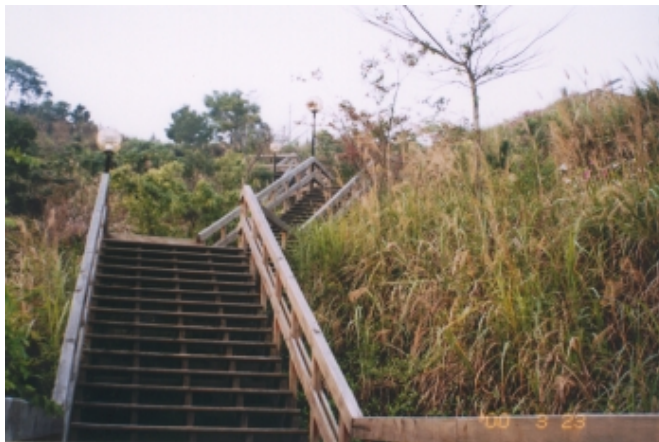
往山頂運動場木質階梯

木梯左右之荒地喬木以相思樹為主，間雜台灣欒樹、苦楝，灌木層以五節芒、台灣芒居多，地披層有牽牛花、兔絲花等；動物方面如麻雀、白頭翁、綠繡眼、蝴蝶、松鼠等多種。木梯上端右側是新建網球場，沿著蓄水塔旁階梯(58階)往上走，就是山頂運動場了，有籃球場、羽球場及400公尺標準跑道，民眾可在此打球、跑步、作體操等運動，司令台一樓備有洗手間，可供民眾使用。