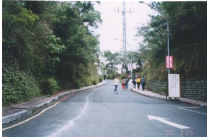
動物中心前陡坡彎道

花崗岩及磁磚階梯步道全長 470公尺 ，部分路段並設行人護欄，為台北市政府北投區公所近年來陸續在本校校園內動物中心至軍艦岩所修建之步道。