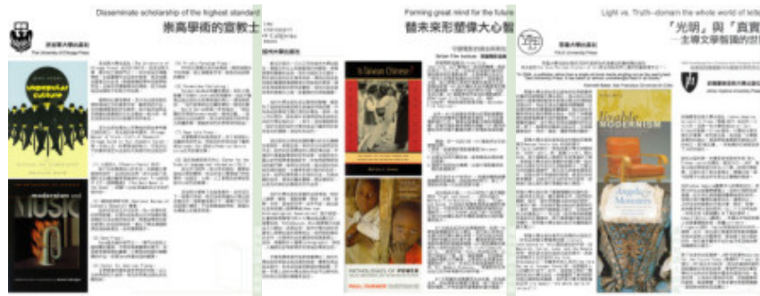
芝加哥大學展示版