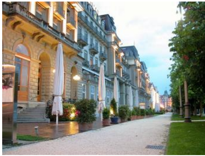
瑞士盧森湖畔飯店