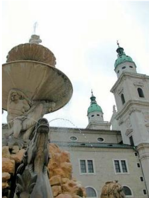
薩爾茲堡主教教堂一