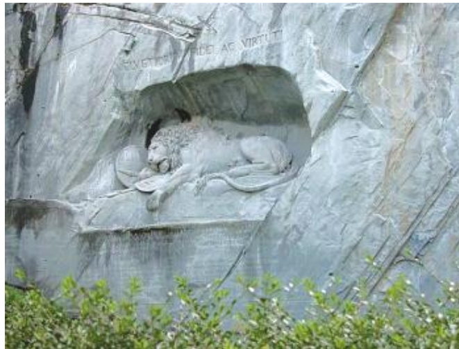
為紀念在法國戰場上捐軀的瑞士軍人，而在冰岩上雕刻了悲傷的獅子