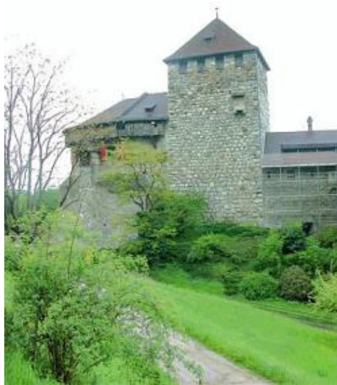
列式頓士敦小國皇宮