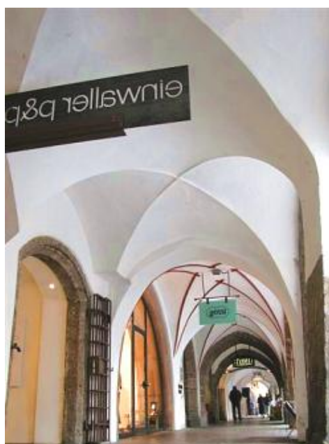
茵斯布魯克哥德式外廊