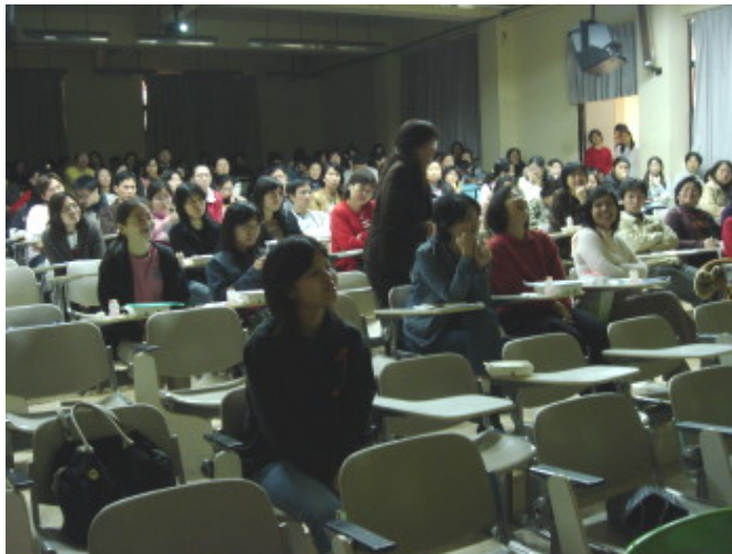
淑芬問及有關蕈菇類問題博得大家會心一笑