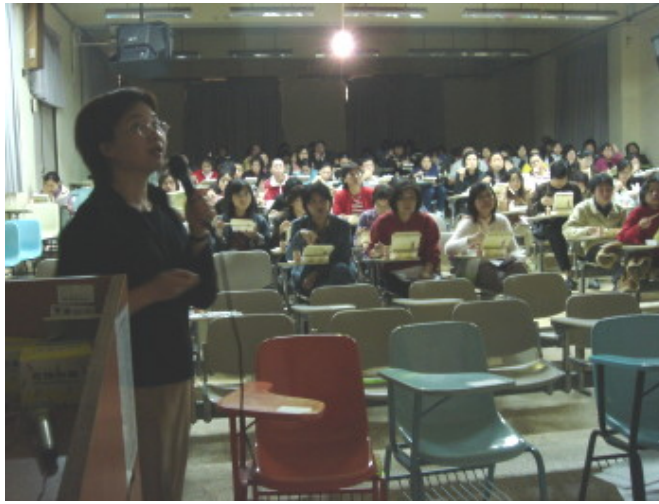
一邊輕鬆用餐一邊專心聽講