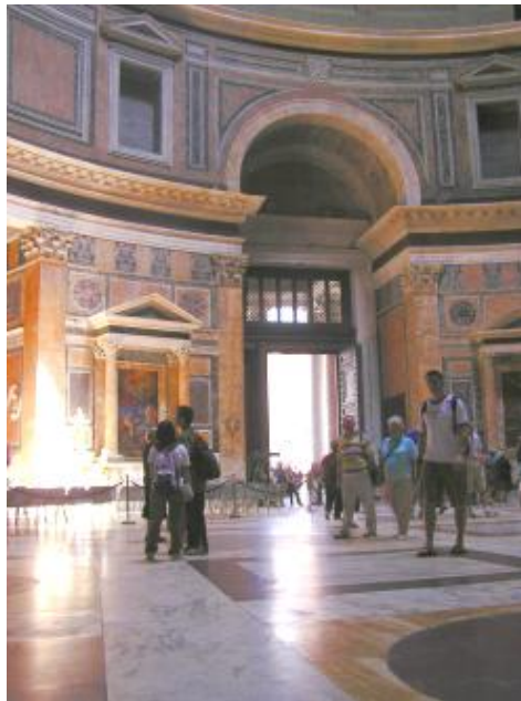
萬神殿 - 令人驚歎的二千年建築