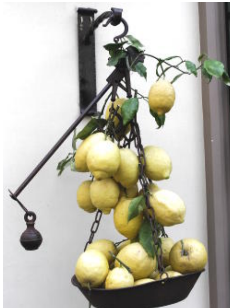
阿瑪菲海岸 - 製作檸檬酒的可愛檸檬