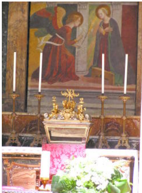
萬神殿 - 天使向聖母馬利亞報喜