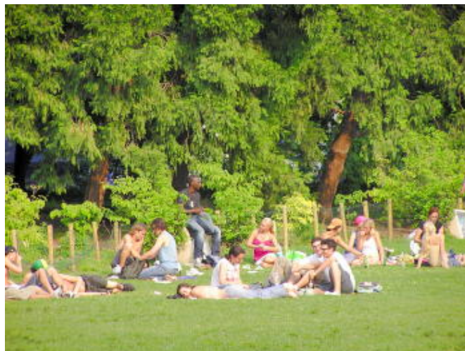
米蘭 - 史佛薩古堡休閒的人群 - 曬傍晚的太陽