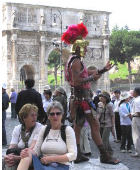
羅馬 - 凱旋門找人合照的羅馬士兵 ( 要收費，偷偷照的 )