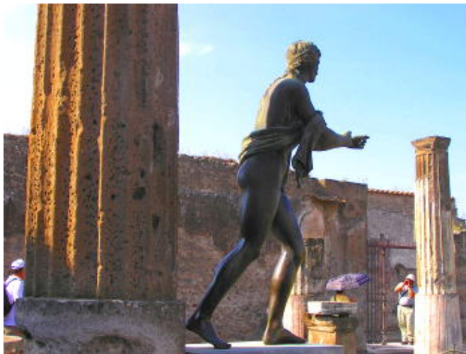
二千年前遭火山灰掩埋的龐貝古城