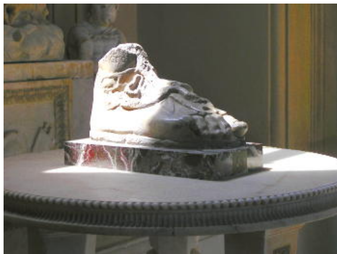
梵蒂岡 - 光影中的殘肢