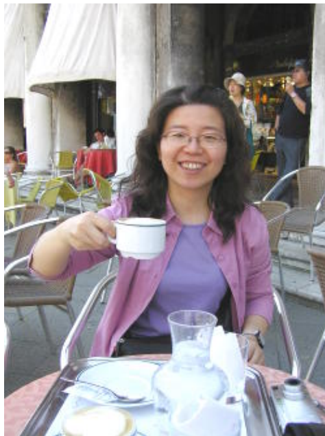
威尼斯 - 聖馬可廣場1杯10歐元的咖啡