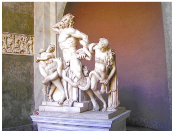
梵蒂岡 - 著名的雕像