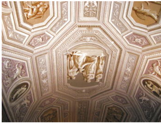
梵蒂岡 - 室內走廊 - 畫的像雕刻的畫