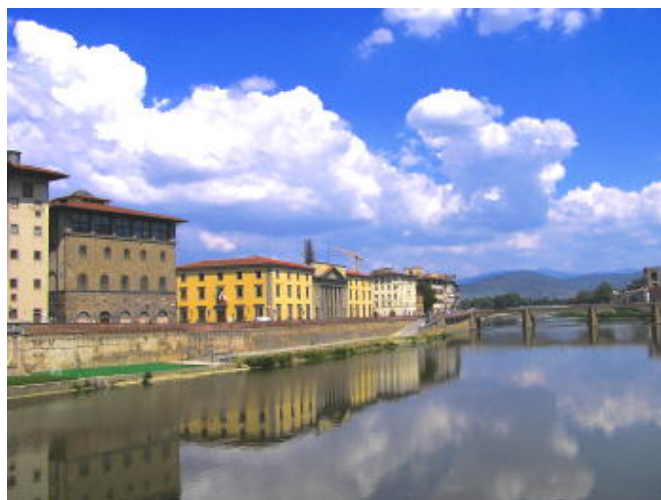
佛羅倫斯 - 烏菲茲美術館外圍