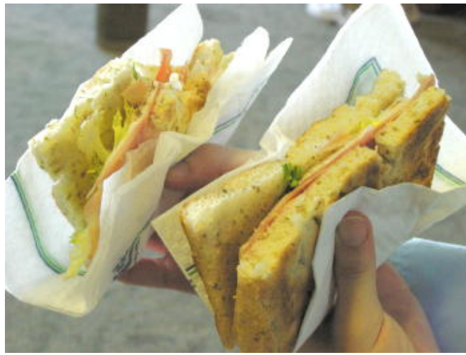
羅馬機場的義式三明治