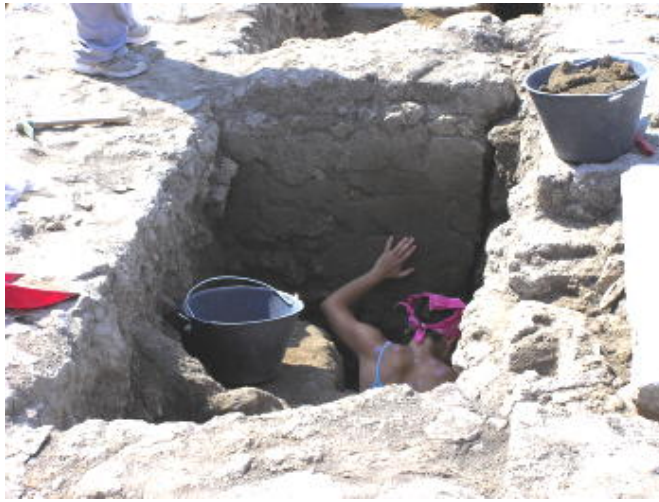
龐貝古城 - 繼續挖掘古蹟中