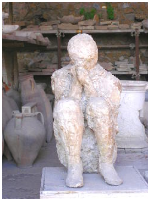
二千年前遭火山灰掩埋 - 龐貝古城 - 掩面防灰的人