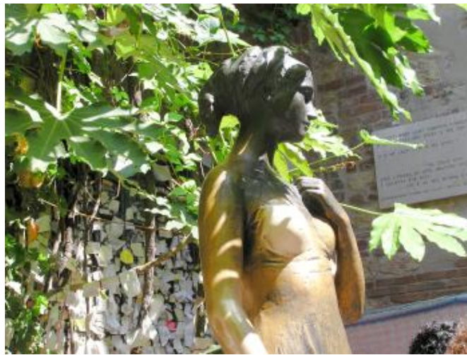
維洛納 - 茱麗葉像