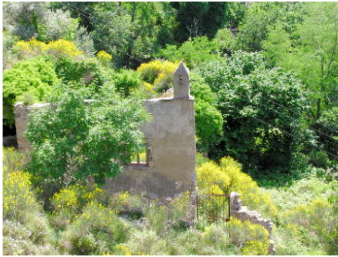
搭乘卡布里島纜車 - 向下眺望