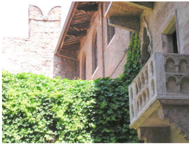
維洛納 - 羅密歐與茱麗葉見面的陽台