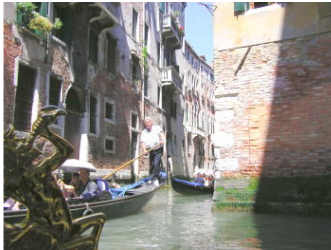
搖櫓船的威尼斯水巷