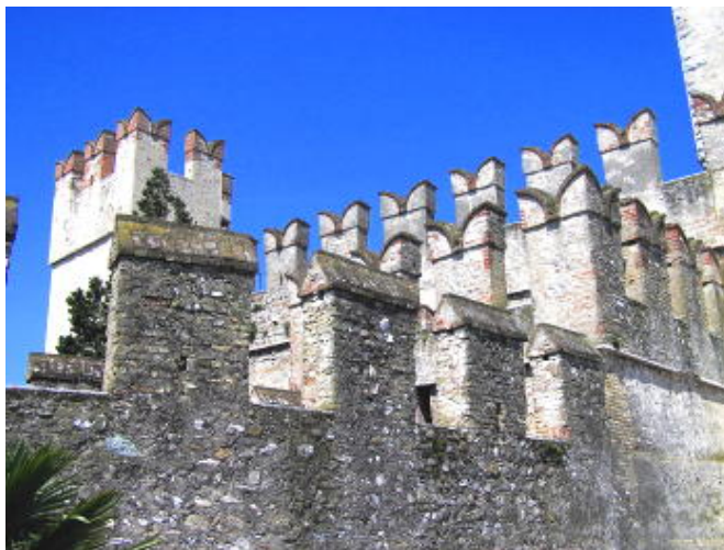
西米歐尼小鎮 - 中世紀古堡