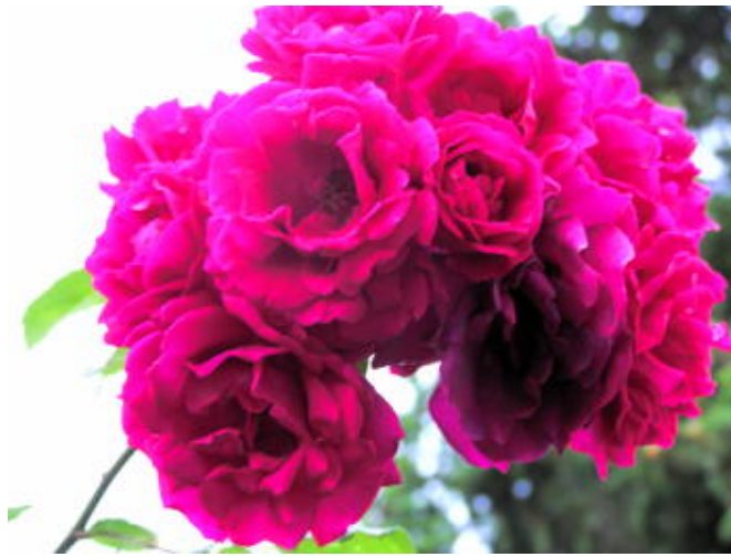
隨處可見 - 怒放的花朵