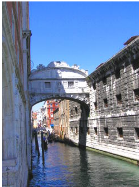
威尼斯 - 嘆息橋 ( 過橋到右邊就是永不見天日的監獄了 )