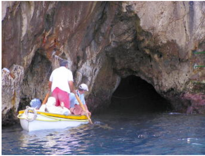
卡布里島 - 著名的藍洞就從此處進入