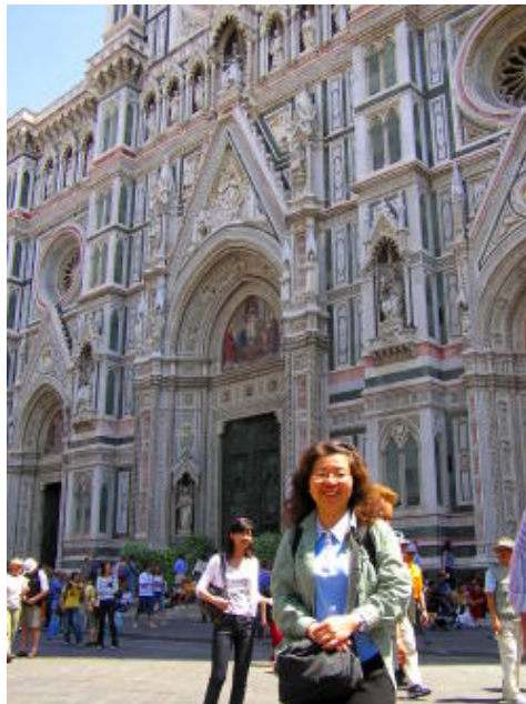
佛羅倫斯 - 聖母百花大教堂