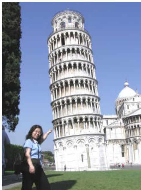
比薩斜塔 - 一指神功