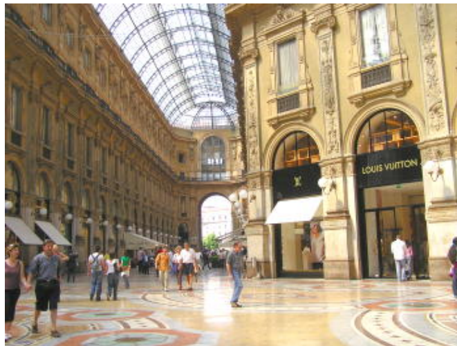
舒適典雅 - 米蘭 - 名牌購物街