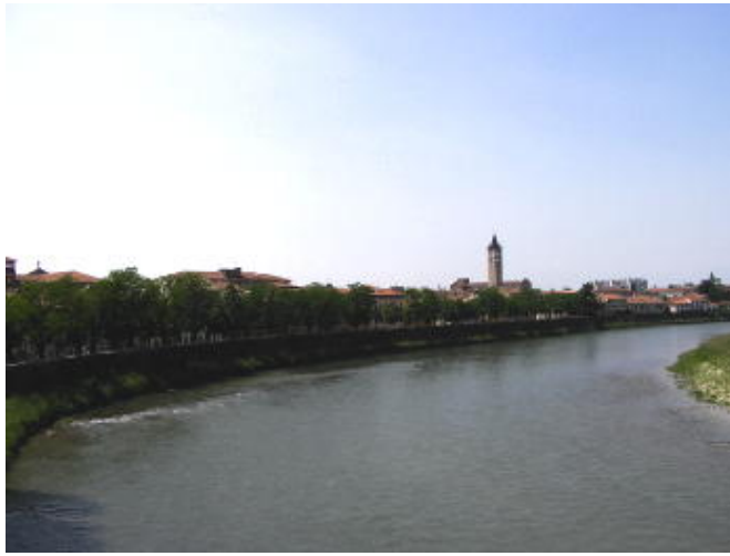
史卡利傑羅橋 - 眺望遠方