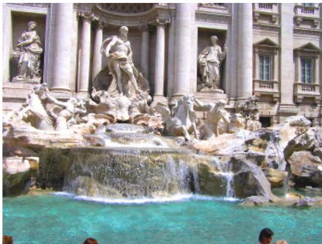
羅馬 - 許願池 ( 少女泉 · 丟一個銅板會再回到羅馬 )