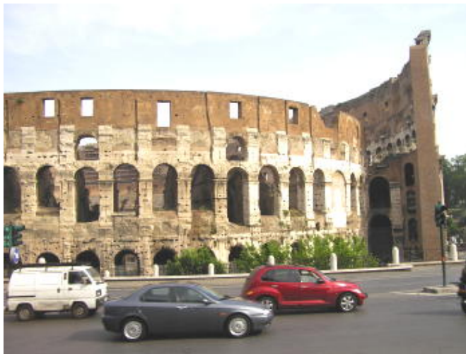
羅馬 - 鬥獸場