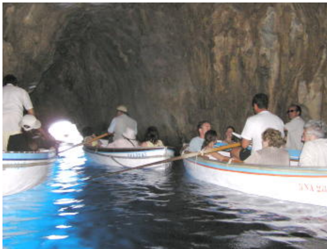
藍洞的藍 - 令人嘆為觀止，可惜相機照不出來