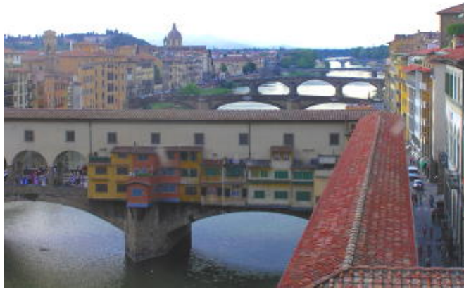
佛羅倫斯 - 烏菲茲美術館眺望舊橋