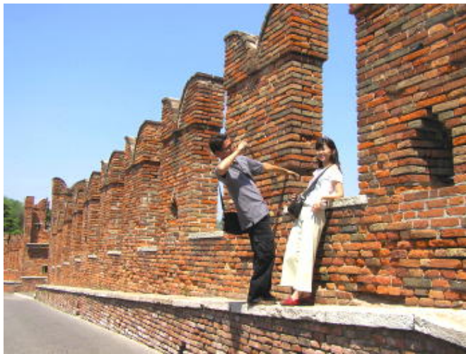
史卡利傑羅橋上拍照的蜜月夫妻