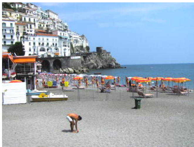
沒有時間下去游泳的阿瑪菲海岸