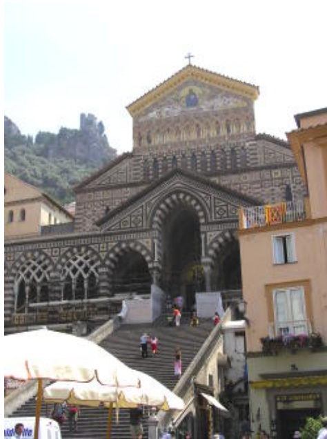
阿瑪菲海岸的聖安德列教堂