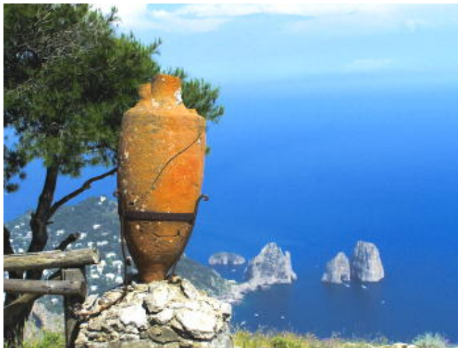
卡布里島最高點 - 向下眺望