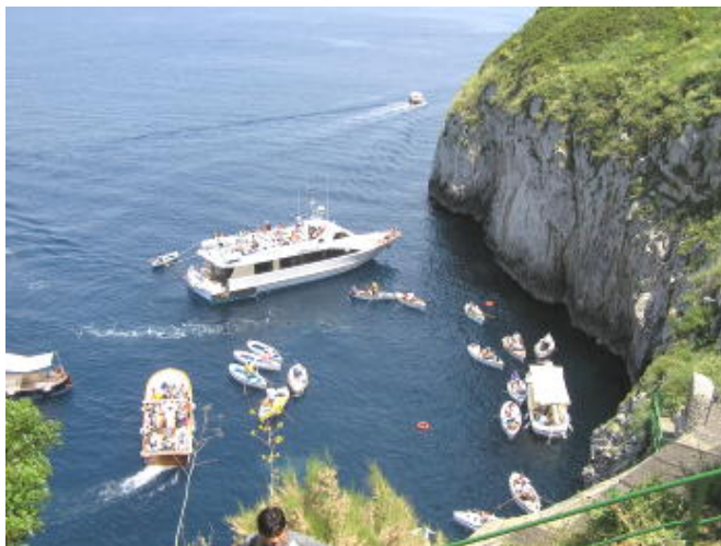
藍洞外湛藍的海水