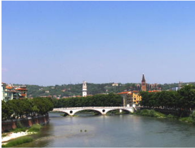
史卡利傑羅橋 - 眺望遠方