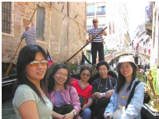
搭搖櫓船的我們 - 水有點臭但很有趣