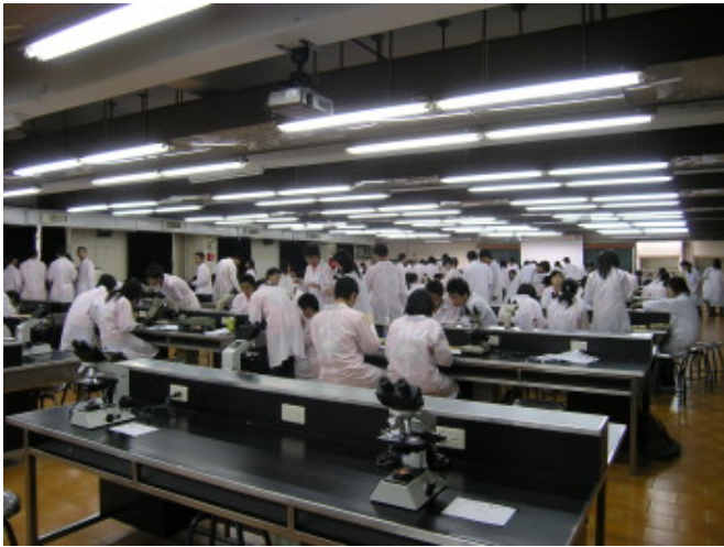
第十四屆全國高中生醫學研習營活動流程表