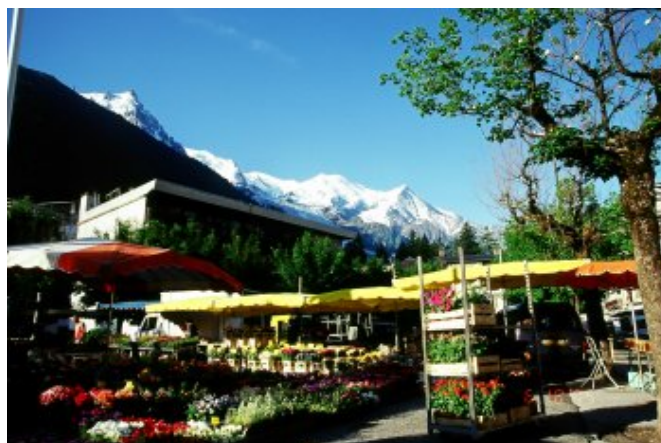
在終年積雪的高山映襯下，朝市中的繁花更顯繽紛奪目

怨雖怨，打探好了第二天早上開始營業的時間，我們還是把握時間像個觀光客般的在鎮上遊蕩。霞慕尼的商業氣息頗重，店家所販售的商品價格都令人咋舌，我們很快就放棄在此地購買紀念品的想法，找到一家精緻的蛋糕店喝杯下午茶犒賞自己，畢竟來歐洲就是要享受悠閒的，不是嗎？