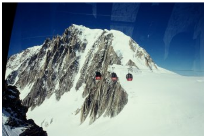
和對向的纜車遙遙相望