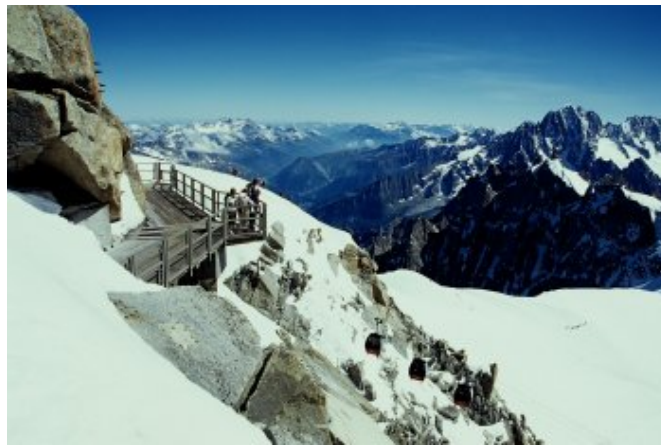
從眺望台上俯覽群峰

看到那些登山客如此專注的一步一腳印，小心翼翼的踩在前人的路線上，深恐稍有不慎便落入深淵，這時才感覺到人類之渺小和造物者之偉大。