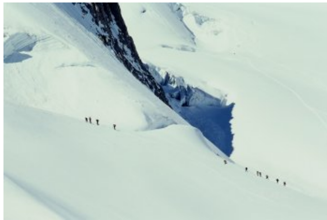
在大自然面前，人如螻蛄般渺小

山上空氣清冷而稀薄，必得以輕鬆緩慢的腳步——行來，否則頭痛欲裂、耳鳴暈眩的高山症就立即襲捲上身。性急的我就是因為貪看峰頂的景色，走得疾快了些，後來險些昏倒在眺望台上。