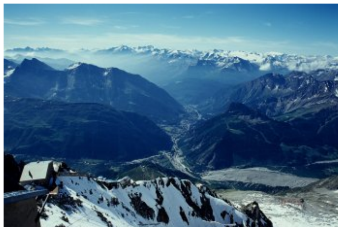
山下是義大利國境

尾隨在這些登山客的後面搭乘纜車，我們購買的是ABC線的來回票，也就是必須經過三站，其中A站是中繼站，B站是站在白朗峰頂看天下，C站拉到對峰回頭觀賞白朗峰的偉岸氣勢。