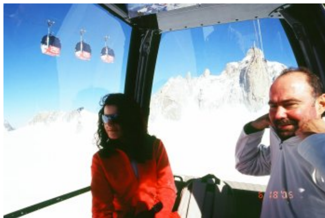
纜車內有暖氣，同車的老外熱到要脫外衣

天色漸漸明亮起來，公園周遭開來一輛輛的卡車，小販們各自擺出花卉、水果、烤雞、海鮮和各類日常用品，我們被烤雞的香味誘惑到不行，但是顧慮到只喝了一杯咖啡的腸胃，是否能消受得了油滋滋的烤雞？最後理智戰勝口腹之慾，烤雞展開翅膀飛走了。