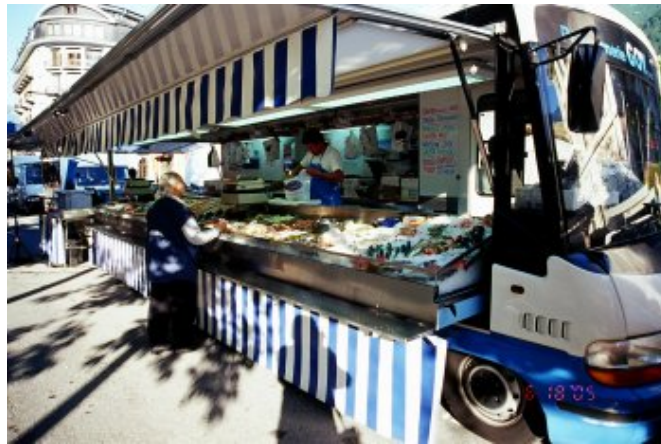
大型的貨櫃車打開側身就是一個臨時攤位

空著肚子逛了一圈，看到火車站內設有咖啡自動販賣機，便快步走進去，當我們還在研究如何投幣時，兩位可愛的老太太主動上前，以行動為我們示範步驟。買到咖啡，大家相視一笑，相逢真是有緣，感覺又是美好的一天。