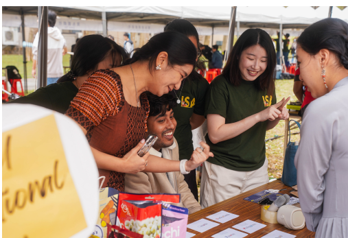
國際日促進校內外本地生及境外生文化交流、增進彼此認識互動的機會，