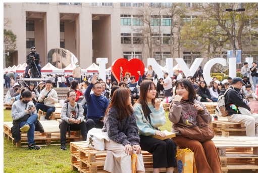
現場觀眾熱烈參與