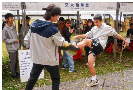
社團攤位為校慶增添趣味