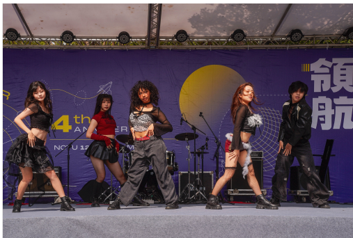
精彩社團表演為校慶增添活力