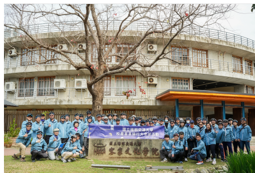
「領航號」單車騎行串聯校區，從六家校區經博愛校區最終至光復校區參加校慶大會