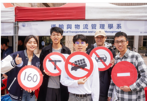
校系博覽會向高中生介紹學系特色、校園生活，讓師生更深入了解環境及方向