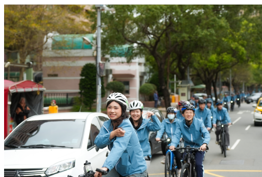
「領航號」單車騎行串聯校區，從六家校區經博愛校區最終至光復校區參加校慶大會