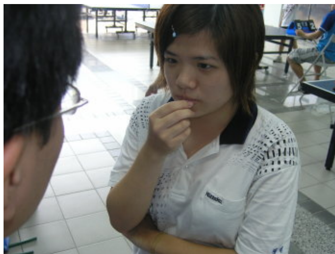
教練對選手面授機宜