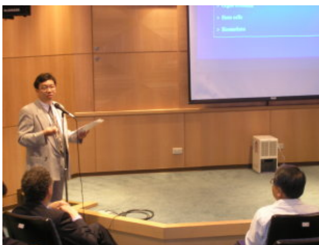
謝世良老師介紹Joseph Bonventre教授

Joseph Bonventre教授是生物物理學領域的專家，現場參與聽眾十分踴躍。由謝世良老師為大家介紹Joseph Bonventre教授的學經歷及背景；演講時，Joseph Bonventre教授深厚的專業素養，令聽眾不禁筆記得十分勤快，深怕漏失任何一個細節或重點，皆有滿載而歸之感。