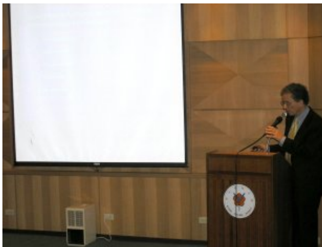
Joseph Bonventre教授與大家分享他的專業