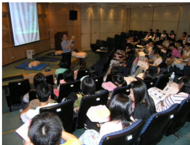
講師為同學介紹心肺復甦數

課程內容包含演講與技術操作二部份。演講內容含認識呼吸心臟停止及心肺復甦術、認識上呼吸道阻塞及哈姆立克急救法；技術操作含心肺復甦術、哈姆立克急救法、人工甦醒球使用等合計四小時課程，由新光醫院醫師及護理人員為參加者進行詳盡說明。