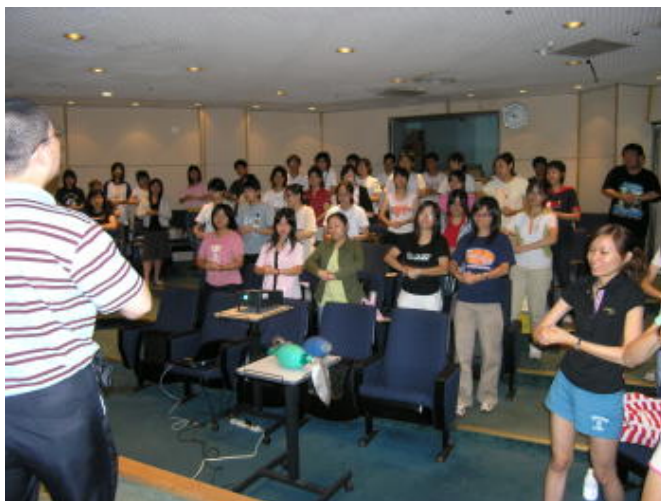
練習「哈姆立克急救法」

訓練課程中，一再不斷提醒的就是依循「叫叫ABC」口訣的簡易心肺復甦術（CPR），即：