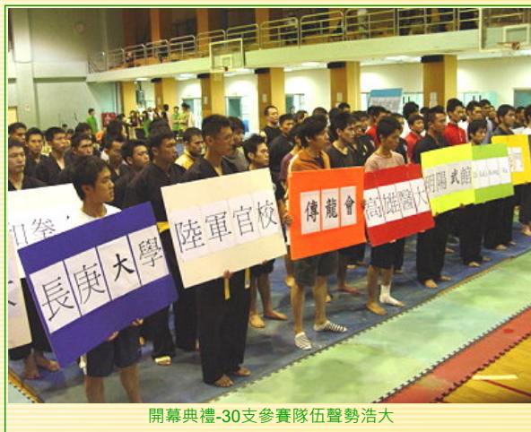
開幕典禮-30支參賽隊伍聲勢浩大