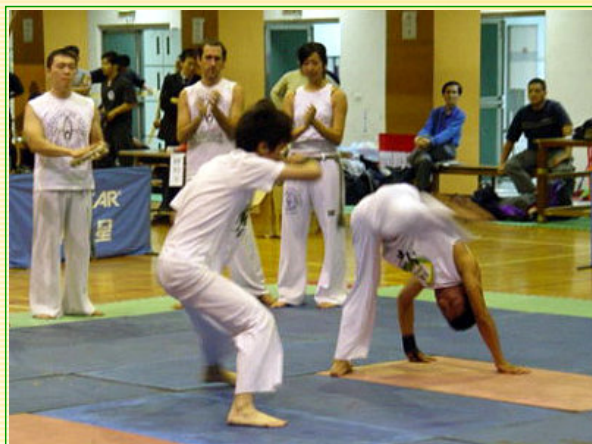
開幕表演-卡波耶拉

緊接著是精采的開幕表演，首先由中華運動柔術籌備委員會帶來結合運動與防身的運動柔術表演，接著是台灣菲律賓魔杖協會帶來在台灣難得一見的魔杖表演。刀杖互擊所發出金石之鳴，讓觀眾嘖嘖稱奇。還有陽明熱舞社帶來的熱舞表演，為比賽注入青春活力。最後的表演是「Capoarte」帶來的巴西傳統飛旋鬥舞-卡波耶拉，同樣也是奇特的武術，他們的動作混合了武術、競賽和舞蹈，並且現場打擊樂器與合聲歌唱，將現場渲染一股愉悅的氣氛，而第三屆陽明盃的激烈比賽也即將開打。